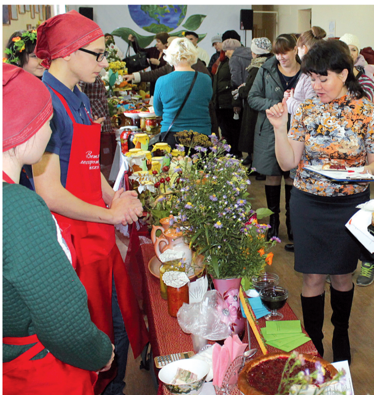
Жюри оценивает экспозицию ВЛАТТ