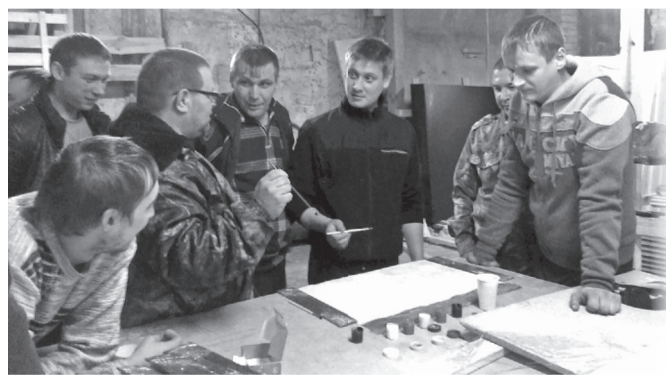
■ Творческий процесс.

Все откликнулись и дружно собрались на праздник в красном уголке. Пришли работники библиотеки И.П. Казакова и Н.В. Качалова. На столе осенние букеты, любовно составленные умелыми руками женской половины нашего коллектива, тёплые пироги местного хлебозавода, конфеты, чай.