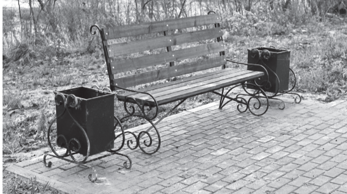
■ Продолжает преобразоваться набережная реки Ветлуги. Заняли своё место скамейки и урны, изготовленные специалистами ООО «Ветлужский завод нестандартного оборудования». Хочется надеяться, что те, кто приходит на аллею провести своё свободное время, будет относиться к общегородскому имуществу бережно, а к чужому труду – с уважением.