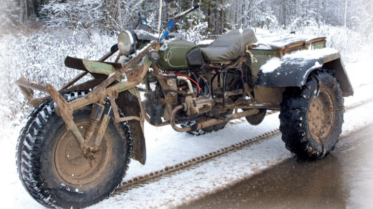
Самодельная чудо-техника.