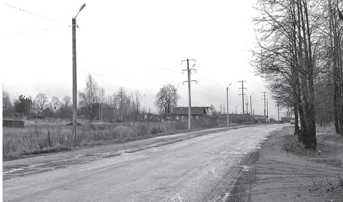
■ Новые опоры линии электропередачи «выросли» на ул. им. П.Ф. Гусева.

По приказам избирателей, в микрорайоне, между многоквартирным домом № 17 и детским садом № 5 «Калинка», установлены четыре новых уличных светильника. Появилось дополнительное освещение и на площади 1 Мая: три уличных светильника установлены над скамейками в скверах.