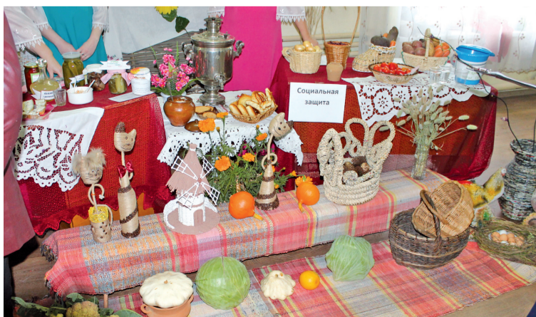
Экспозиции участников ярмарки-выставки «Экофест».