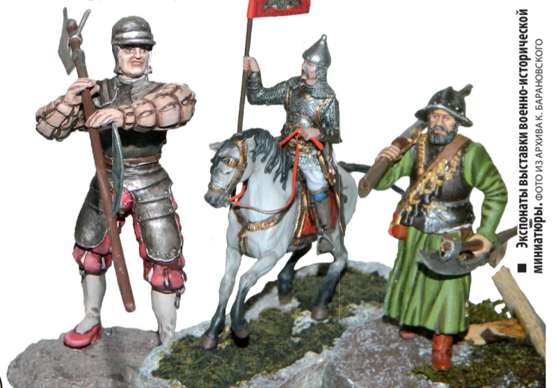
Экспонаты выставки военно-исторической миниатюры.