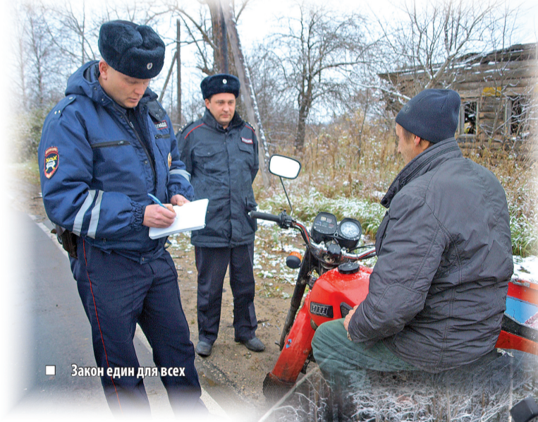
Закон един для всех