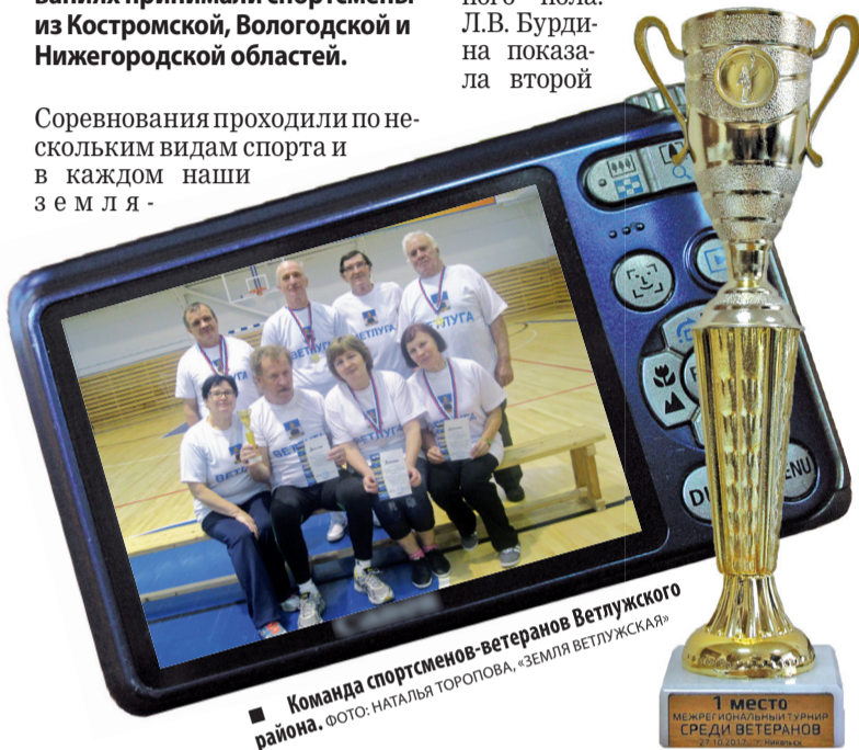
Команда спортсменов-ветеранов Ветлужского района.