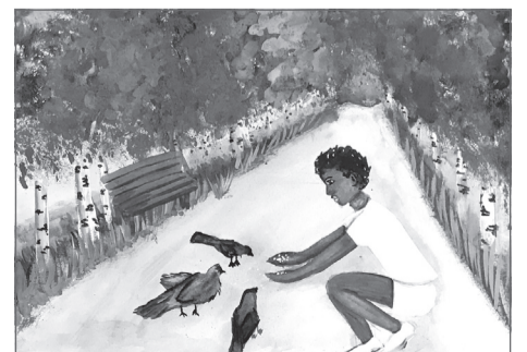
■ Лучшие работы конкурса детских рисунков «Такой огромный мир: Африка и Ближний Восток».