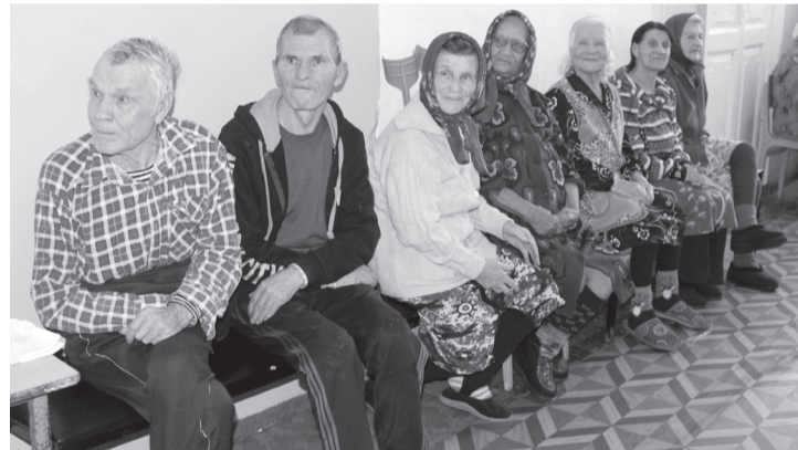
■ Внимательные слушатели.