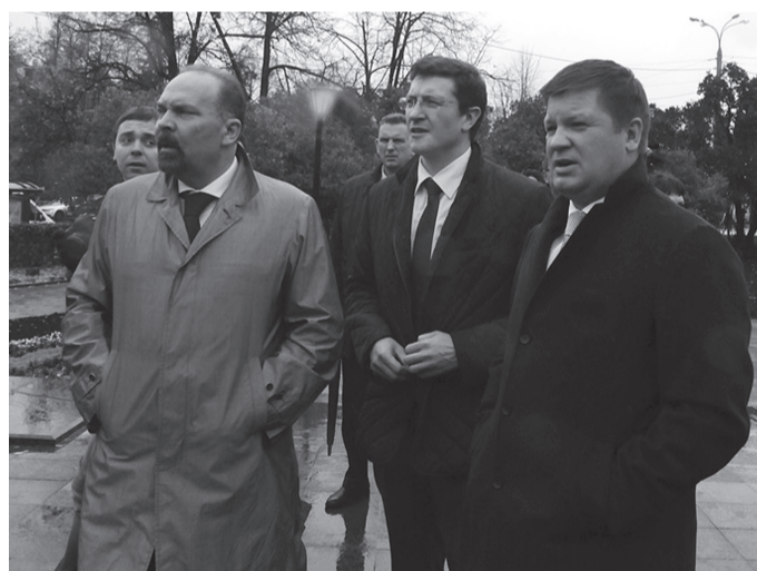
■ Слева направо: министр строительства и ЖКХ Михаил Мень, врио губернатора Нижегородской области Глеб Никитин, полпред Президента России в Приволжском федеральном округе Михаил Бабич осматривают объект.

– Например, объём строительных работ в целом по ПФО за восемь месяцев года оценивается к прошлогоднему показателю в 92 %. Не дотягиваем до среднероссийского уровня, – констатировал полпред Пре-