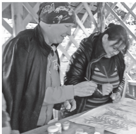
■ Рисуем картину на тему «Лес – наше богатство»