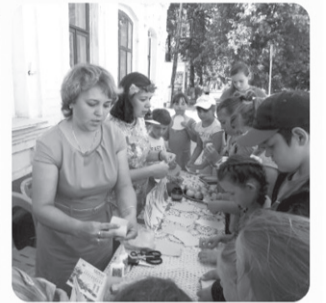
■ На закрытии Летних чтений-2016 в Ветлужской детской библиотеке.

Закончилось весёлое солнечное лето, а с ним и школьные каникулы.