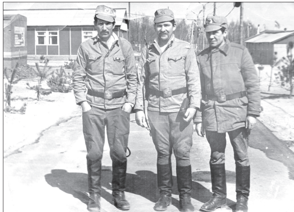
■ Экипаж БРДМ-118 на территории бригады химической разведки.

Три десятка лет прошло с той страшной трагедии, но тревожные воспоминания не отпускают. Юрий Александрович никому не желает пройти через такие же испытания. Говорит, пусть атом будет только мирным и не угрожает человечеству.