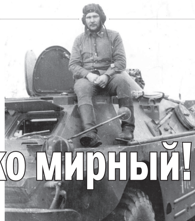
■ Отдых после разведки в 30-километровой зоне отчуждения

– Жил я тогда в Усинске (Коми АССР), работал водителем автомобиля в нефтяной промышленности. Волей судьбы попал в Чернобыль в декабре 1986 года, – неторопливо вёл он своё повествование, сидя в редакционном кабинете. – Включили в состав 26-й бригады химической разведки. Всё, что там увидел, не укладывалось в голове. Был водителем БРДМ (боевая разведывательная машина). Работали постоянно в 30-километровой зоне отчуждения, искали очаги с сильным радиационным фоном, которые затем фиксировали флажками. Приходилось работать из здания станции. Проводили дезактивацию. Первыми к заражённому участку работали мы, разведчики. На заражённом участке находились определённое время – в зависимости от степени его заражения, от количества рентгена. В сильно заражённой зоне иногда работали только по 15-20 секунд в день. Перед выходом на объект надевали защитные костюмы. Командир ставил задачу, мы «залетали» на объект и хватали первое, что попадалось под руку: разные осколки, куски бетона, камни. Выкидывали всё это в окно. И покидали по-