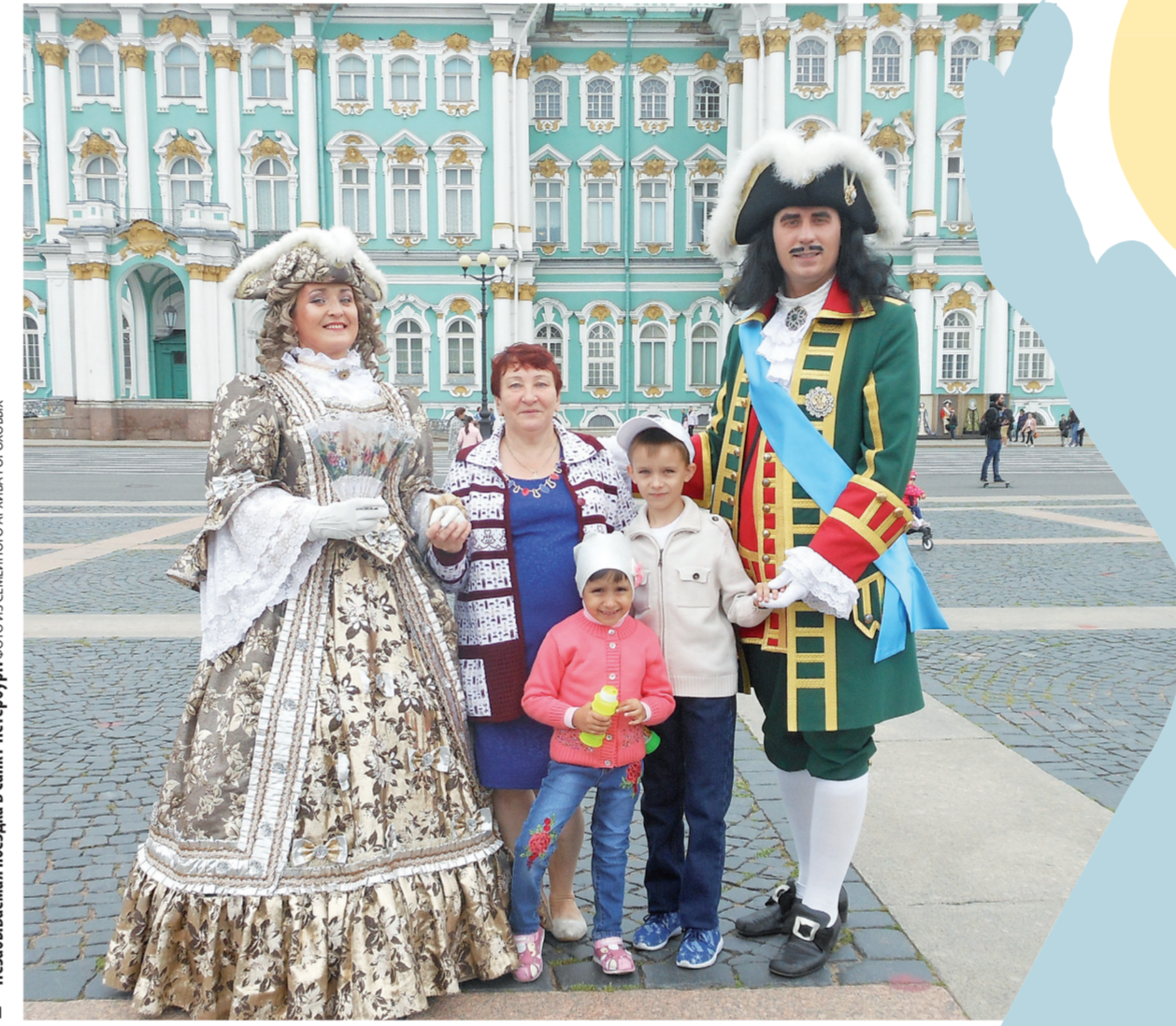
Незабываемая поездка в Санкт-Петербург.