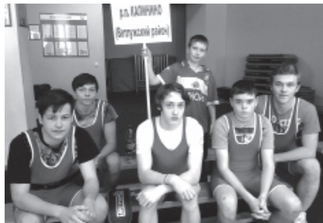
■ Команда калининских пауэрлифтеров