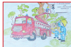
■ Рисунок Дениса Кремнева