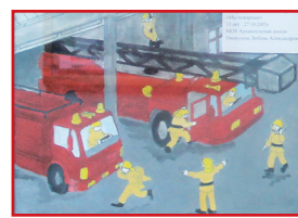
■ Рисунок Алины Онокулевой