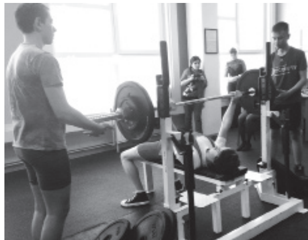
■ Выполняется упражнение классический жим штанги лёжа