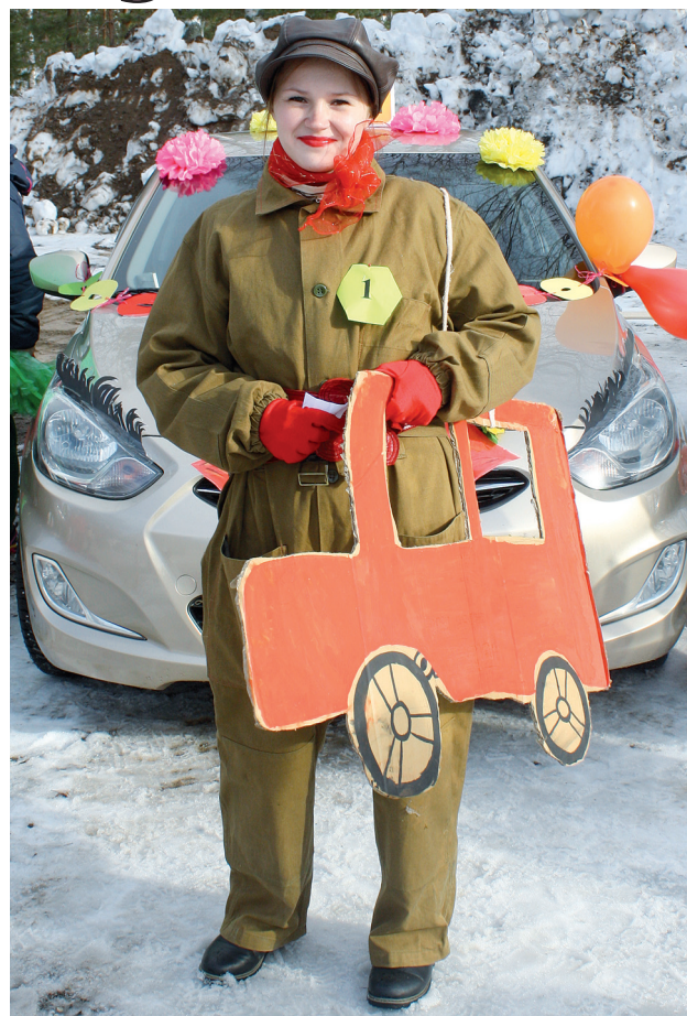
«Социальное такси» Елены Голиковой – помощь всем нуждающимся