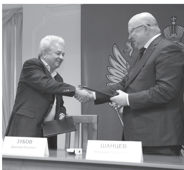
■ Председатель Центрального Союза потребительских обществ Д.Л. Зубов (слева) и губернатор Нижегородской области В.П. Шанцев подписали соглашение о сотрудничестве.

– Подписанное губернатором Валерием Шанцевым соглашение имеет принципиальное значение, – считает председатель агропромышленного комитета Законодательного собрания Нижегородской области Игорь Тюрин. – Необходимость помочь частникам