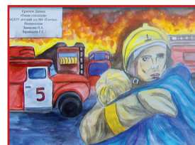
■ Рисунок Даниила Краснова