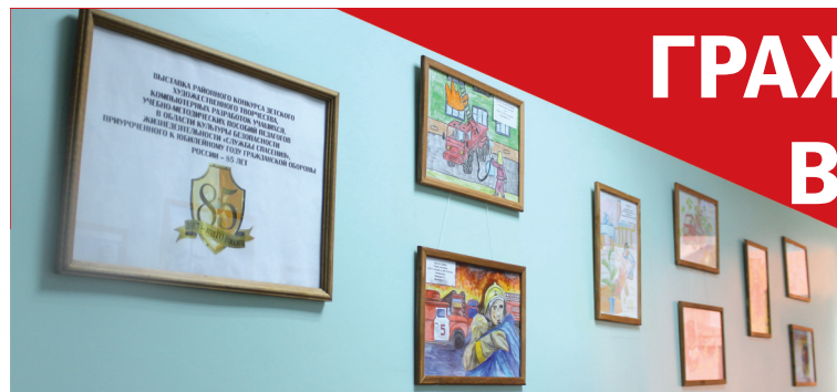
■ Выставка конкурсных работ – детских рисунков на тему «Службы спасения» – размещена на втором этаже администрации Ветлужского района.

В Ветлужском районе во второй половине февраля проходил районный конкурс детского художественного творчества, компьютерных разработок учащихся, учебно-методических пособий педагогов в области культуры безопасности жизнедеятельности «Службы спасения».