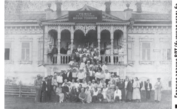
■ Главное здание ВПТ (бывшая усадьба лесопромышленника Бердникова), 1921 г.