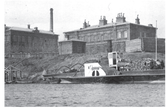
■ Вид с. Ветлуги на Государственный водочный завод: производственное здание (слева) и дом для работников

В летнее время овощи, в особенности огурцы, привозились на продажу из таких деревень как Исаиха, жители которой в совершенстве овладели умением выращивать прекрасные, хрустящие