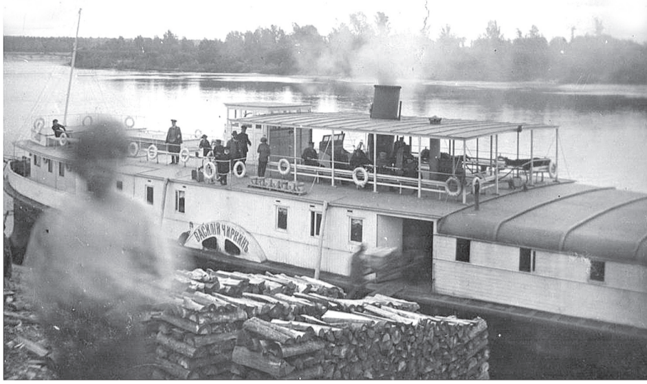
■ Ветлуга начала XX века. Пароход «Василий Чиркин» Чиркина Петра Васильевича.