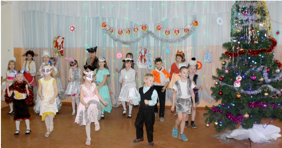
■ Скусающих на новогодней ёлке в Бельшевской школе не было.

Новый год – самый любимый праздник большинства детей и взрослых, который с нетерпением ждут в каждом доме, к нему долго и тщательно готовятся. Вот и мы не остались в стороне.