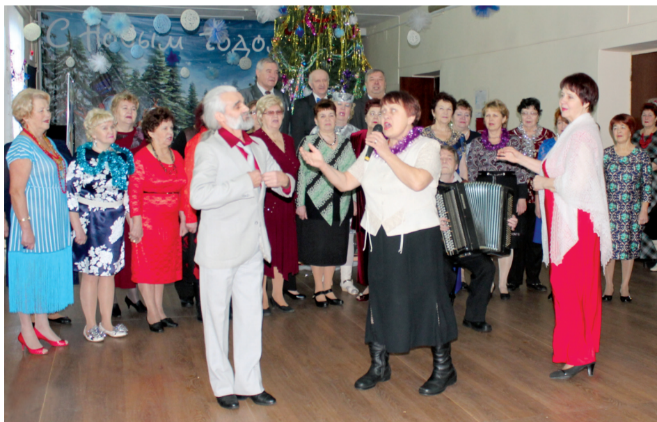
■ У новогодней ёлки ветераны читали стихи, пели песни, веселились...