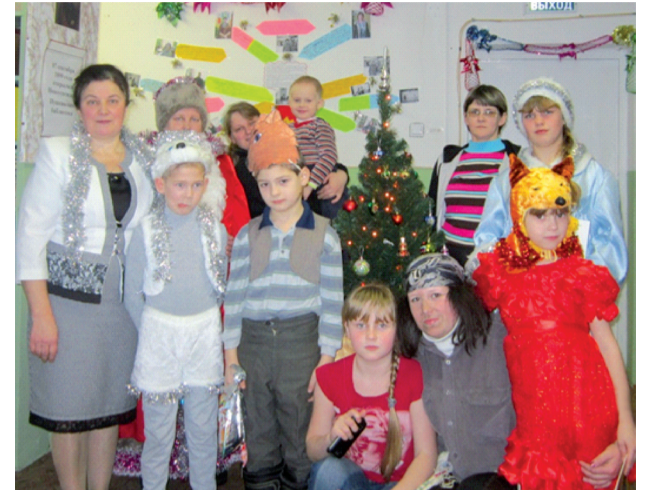
■ Участники новогоднего карнавала в Новоуспенской библиотеке.

Ребята с нетерпением ждали, когда же Дедушка Мороз и Снегурочка «приедут» в библиотеку. И вот этот день наступил. 4 января библиотека пригласила читателей на Новогодний карнавал литературных сказочных персонажей, чтобы окунуться в новогоднюю сказку «Колобок на Новый год». Замечательно были исполнены роли литературных героев. Это и весёлый, румяный Колобок, который, как мячик,