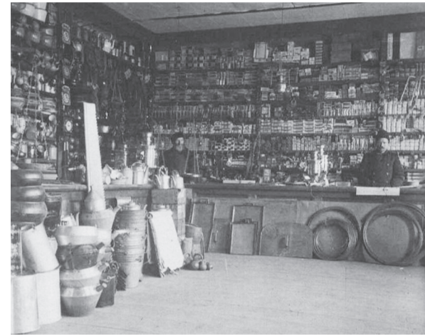
■ Магазины по продаже хозяйственной утвари