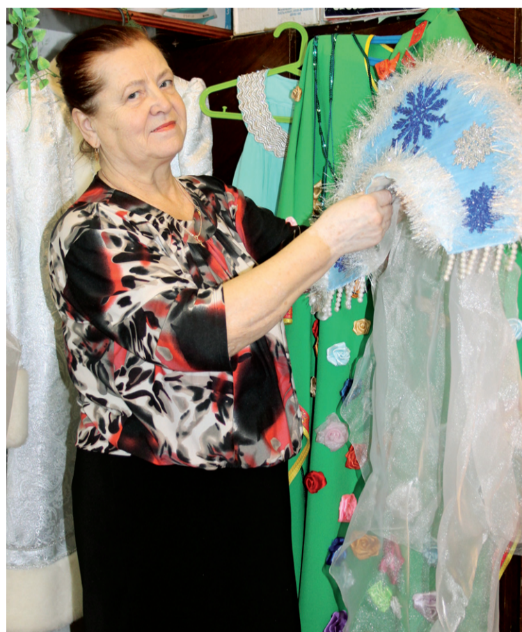
■ Костюмер Т.И. Шапкина.

В 2015 году прошёл декоративный ремонт фасада здания. Благоустройство КДЦ продолжается. В 2016 году сделано новое крыльцо здания, отремонтирован танцевальный класс (побелены стены, установлены новые станки для занятий хореографией, настелен новый пол в зале для дискотек).