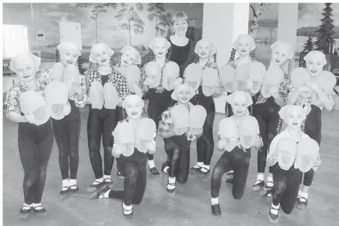
Танцевальный коллектив «Калейдоскоп» покорил ещё одну вершину.

Волшебная сила танцевального искусства собрала в г. Арзамасе самых одарённых и талантливых ребят на Всероссийском конкурсе «Сияние талантов плюс» в рамках проекта «Покорение вершин». Конкурс стал ярким и запоминающимся событием для младшей группы танцевального коллектива «Калейдоскоп» Ветлужского районного дома детского творчества.