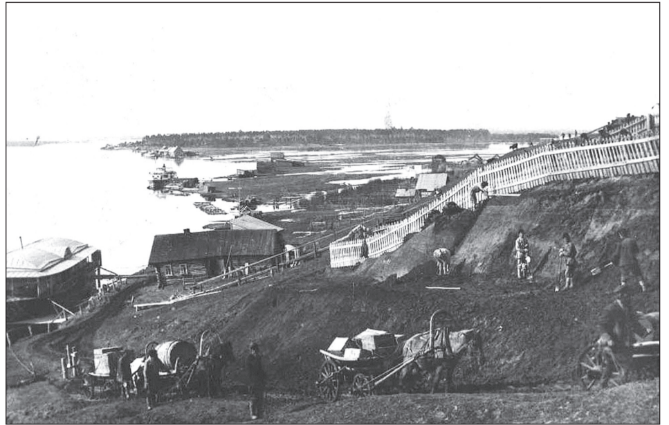
■ Набережная реки Ветлуги

Единственным местом культурного отдыха, если можно так назвать, был Народный дом (позднее кинотеатр). Проведением каких-либо других культурных развле-