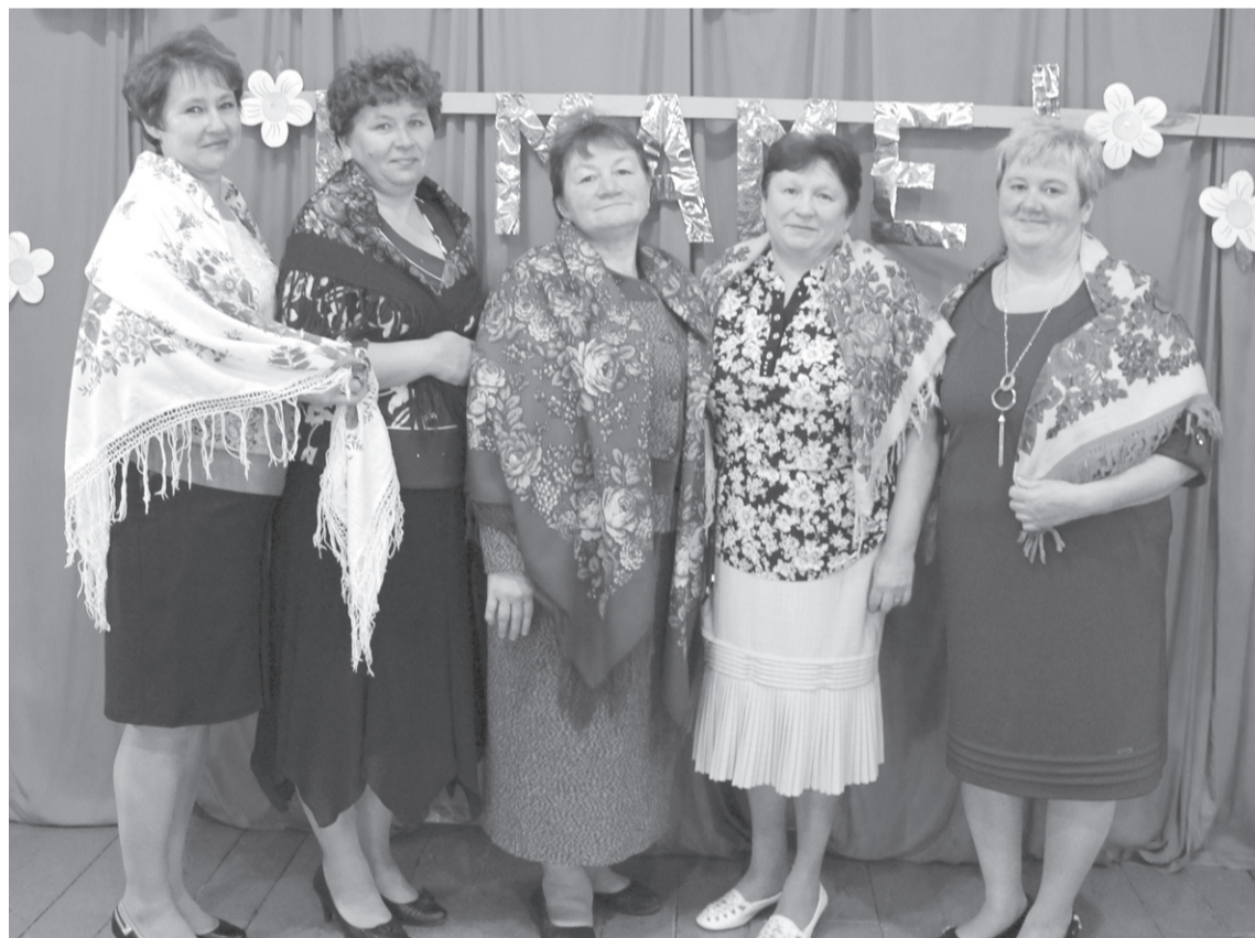
■ Вокальная группа «Калинка».

Вечер закончился праздничным застольем. Сельчанки сами себе устроили это мероприятие. Оно, наверное, на время отвлекло их от каждодневных забот, подарило радость и тепло. Они почти не говорили о своей жизни. Что тут говорить – всё друг о друге давно знают. Искренне радовалась за тех, кому в наше непростое время живётся чуть легче. А вот вдовы – их доля незавидна, но они привыкли жить по средствам, в оди-