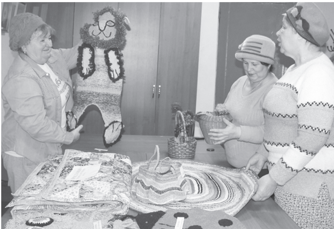
На выставке прикладного творчества.

Она не только вяжет и шьёт профессионально, у неё особый художественный вкус. В изделиях сочетается разные техники вязания.