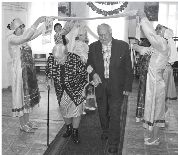
■ Элемент свадебного обряда.