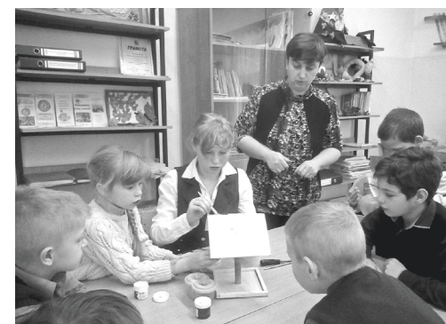
■ Коллективный труд объединяет