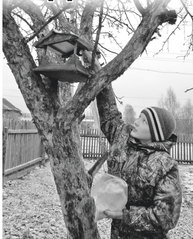
■ «Вот вам, птички, угощение»