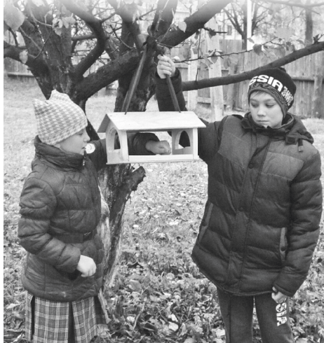
■ Зёрнышки для птиц