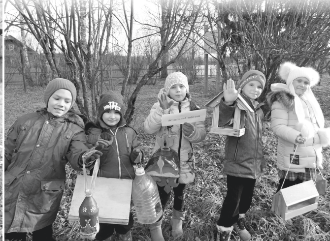
■ Какие разные кормушки в руках детей.

С 6 по 11 ноября Российское движение школьников вновь запустило Всероссийскую акцию «Сделано с заботой», предложив всем заинтересованным и неравнодушным окунуться в удивительный мир пернатых. Цель акции – изготовление кормушек для птиц.