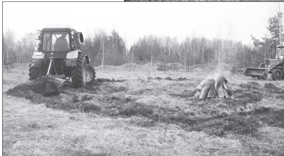
Опашка очага «пожара»