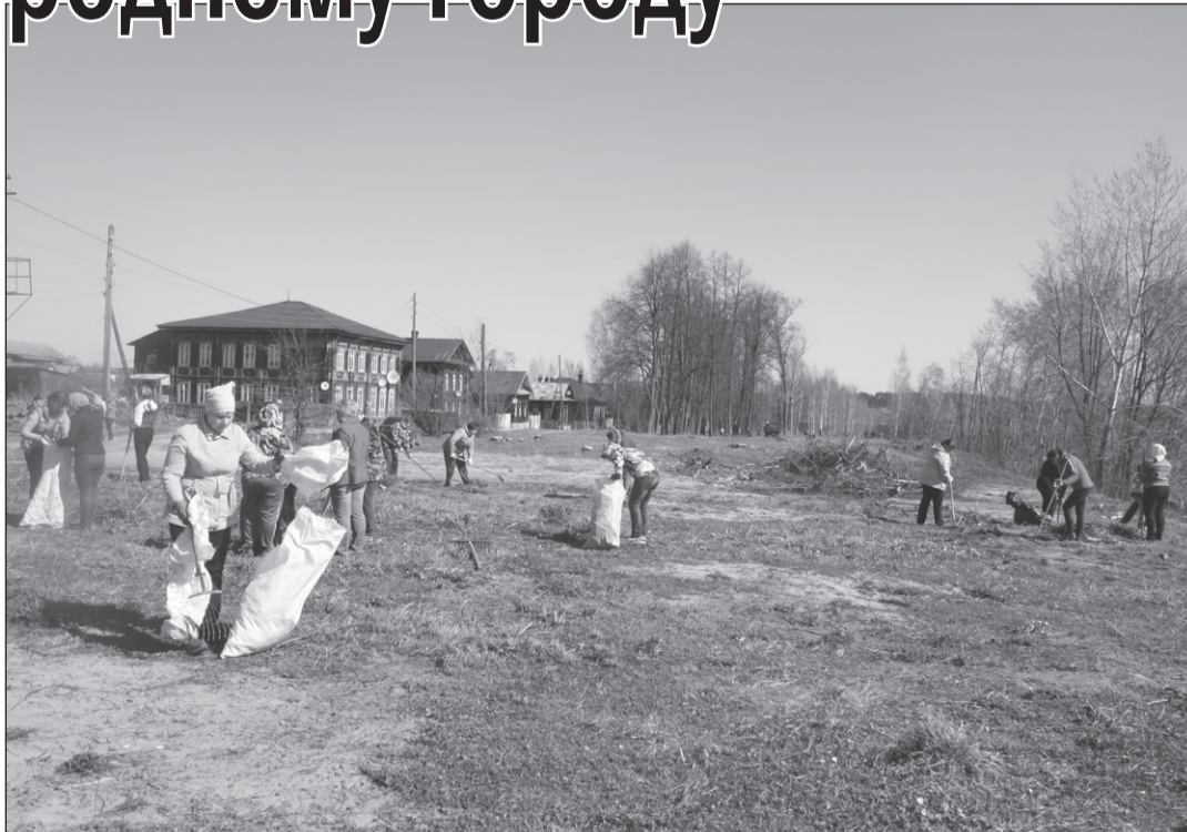
■ На субботнике.