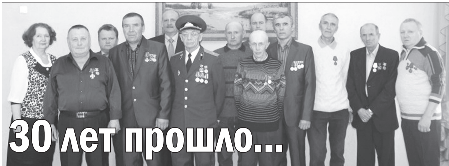
■ Участники встречи.

ИРИНА БЕРЕЗИНА 26 апреля исполнилось 30 лет со дня страшной катастрофы на Чернобыльской АЭС.