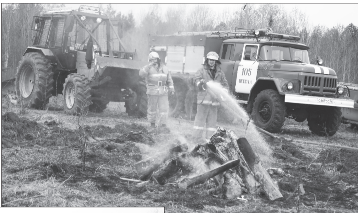
«Пожар» потушен.

Звонок о задымлённости в Ветлужском участковом лесничестве поступил в Ветлужское районное лесничество 21 апреля в 10.00. Через две минуты заместитель руководителя Ветлужского районного лесничества