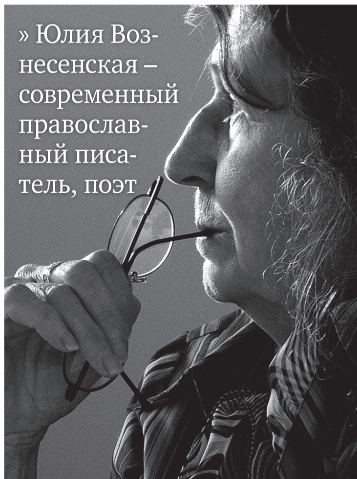
■ Ю.Н. Вознесенская.

» Юлия Вознесенская – современный православный писатель, поэт