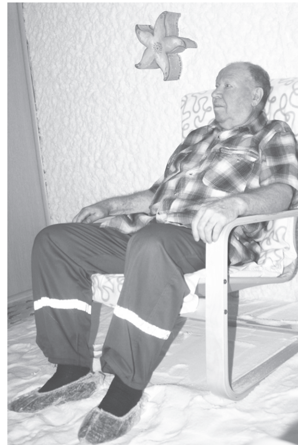
На сеансе галотерапии.

Помните, вдыхая солёный воздух, нужно настраивать себя на то, что вы обязательно будете здоровы!