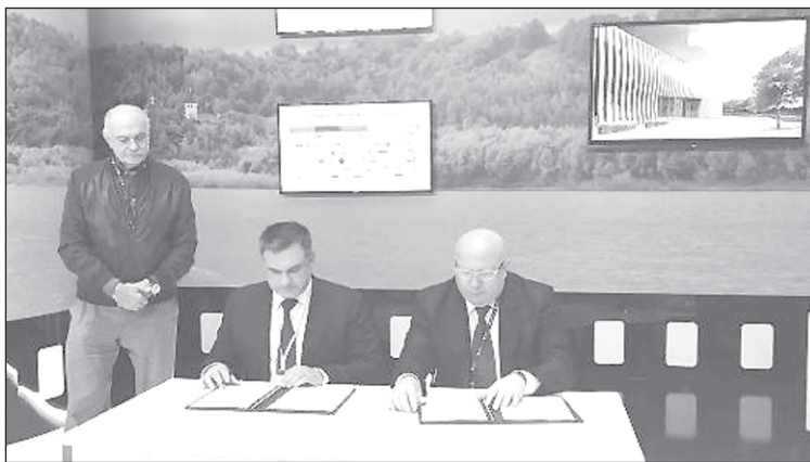
■ На подписании соглашения о реализации проекта «Цитадель».

тадель» составит порядка семи миллиардов рублей, на выходе регион получит 150 рабочих мест, туристический центр, киноакадемию, спортивный комплекс и ещё массу всего. Режиссёр подчеркнул, что решение о создании «Цитадели» именно в Нижегородской области принял не только из-за исключительной красоты местной природы, но и благоприятных