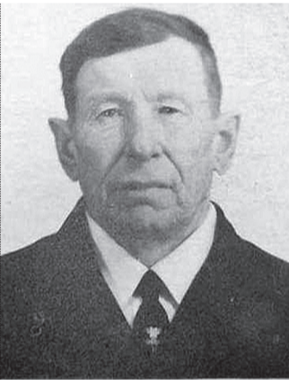
И.И. ЛЕПЕШКИН.