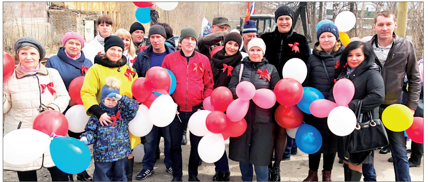
Коллектив ОП «РСК-Дегтярск»

15 марта работники жилищно-коммунального хозяйства отмечают свой профессиональный праздник