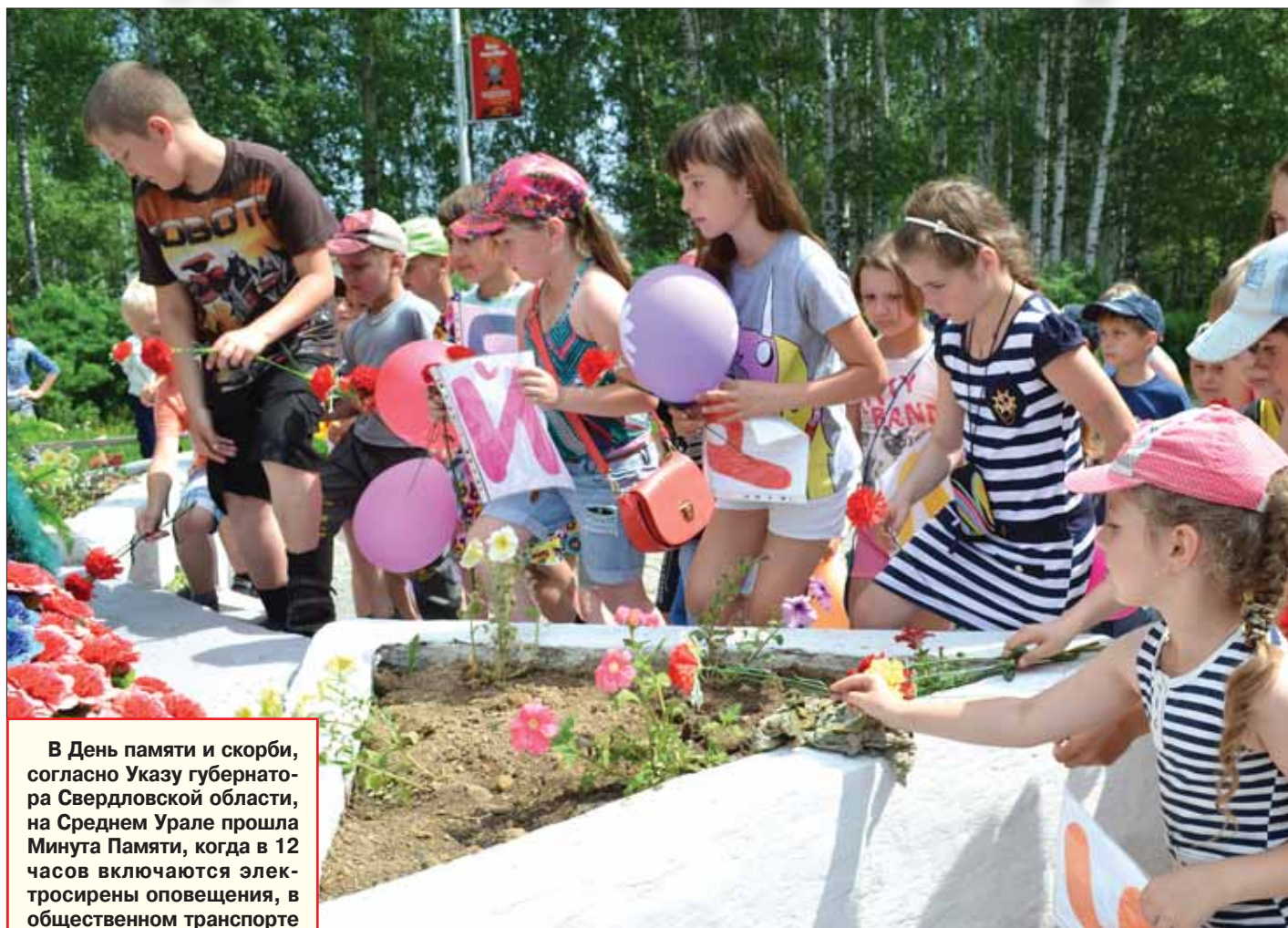
Школьники возложили цветы к обелиску павших воинов

В День памяти и скорби, согласно Указу губернатора Свердловской области, на Среднем Урале прошла Минута Памяти, когда в 12 часов включаются электросирены оповещения, в общественном транспорте обеспечивается информирование пассажиров о проведении Минуты Памяти.