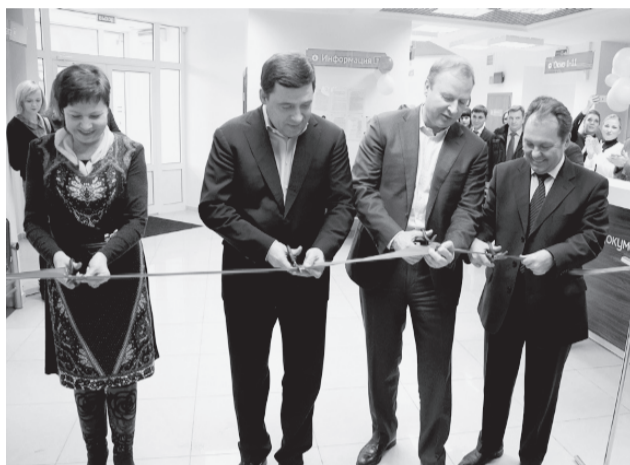
Открытие МФЦ г. Екатеринбург, 30.12.2015 г.