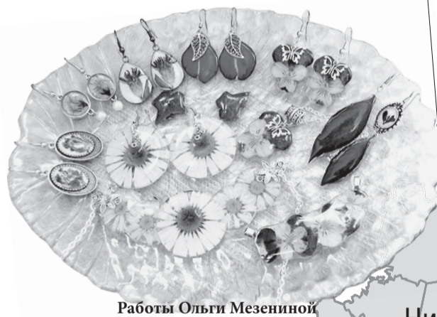
Работы Ольги Мезениной