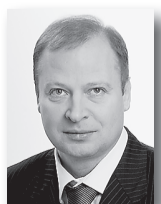
Виктор Шепитый, вице-спикер областного парламента:

«Партпроект «Открытая власть – электронный муниципалитет» нацелен на продвижение механизма получения государственных и муниципальных услуг через многофункциональные центры. Поэтому важна организация обратной связи с жителями региона, с общественностью. Мы хотим знать, что необходимо сделать для повышения качества оказания услуг в МФЦ».