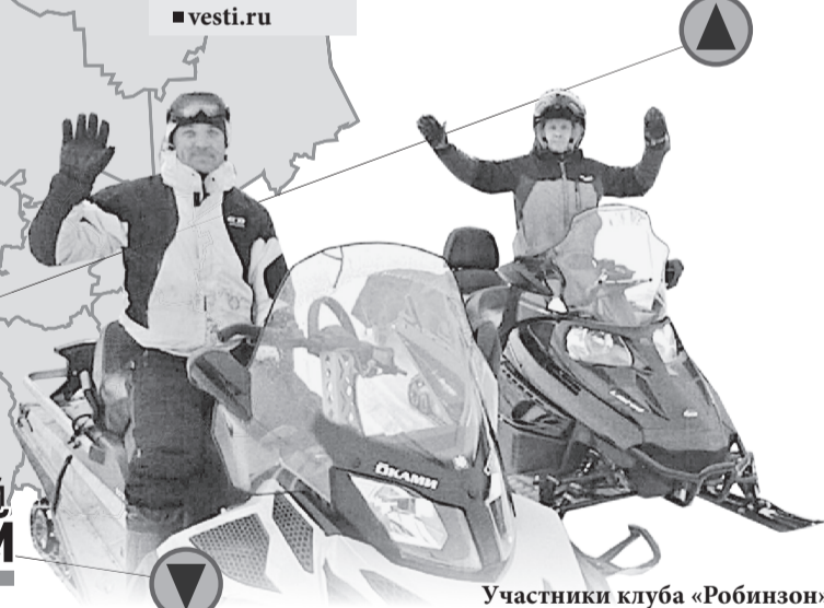
Участники клуба «Робинзон»