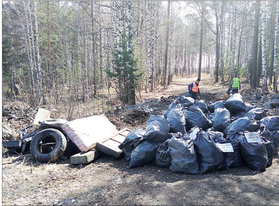
Мусор вывозили просто мешками

Не стоит забывать горожанам и о том, что содержание общего имущества многоквартирного дома включает в себя