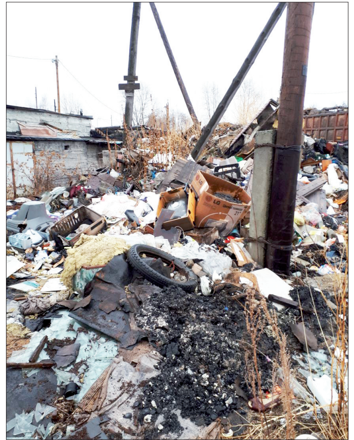
Свалки среди гаражей - дело привычное

Отдельного рассказа достойна следующая новость. Глава города И.Н.Бусахин, при содействии члена Общественной палаты Свердловской области В.Н.Черкашина, добился выделения денежных средств из областного бюджета городского округа Дегтярск на ремонт автомобильных дорог общего пользования местного значения с устройством тротуара (асфальтированной дорожки) по ул.Стахановцев. После неоднократного личного обращения главы Дегтярска к губернатору Свердловской области Е.В.Куйвашеву в администрацию пришло долгожданное письмо с положительным ответом из министерства финансов Свердловской области. В рамках подпрограммы «Развитие и обеспечение сохранности автомобильных дорог на территории Свердловской области» выделено семь миллионов четыреста тысяч рублей на замену дорожного полотна, тротуаров и системы водоотведения. Г.ГОЛОВИНА