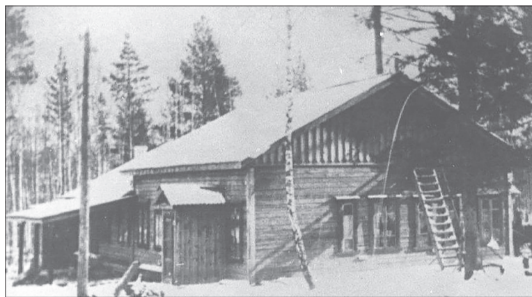
Хлебозавод, 1937 год

В 1936 году образован Дегтярский куст (группа объединенных промышленных предприятий) хлебопечения Ревдинского хлебокомбината, включавший в себя пекарни, столовую, склад, ларек, буфет. В 1941 году создан Дегтярский хлебокомбинат Свердловского треста «Росглавхлеб». Когда началась война, началась мобилизация и на Дегтярском хлебозаводе. Все мужчины уходили на фронт, их заменяли женщины. С тех пор на многие годы коллектив хлебопекарного завода оставался сугубо женским.