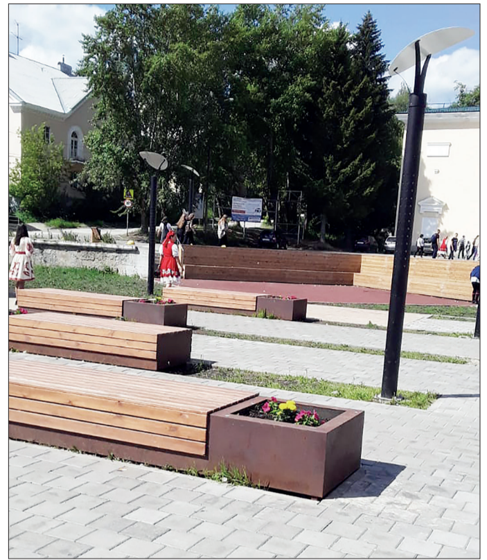
Продолжается реконструкция главной площади нашего города, которая уже стала для многих дегтярцев любимым местом отдыха

просто территорией для отдыха, а средообразующим общественным пространством, где будут сосредоточены зоны тихого отдыха, площадки для занятий спортом, детского отдыха и многое другое. Для достижения этого проект разбит на три этапа, выполнение будет идти в зависимости от финансирования, выделяемого в случае успешного прохождения заявки по сформированной документации.