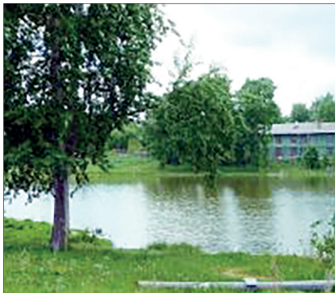
Территория старого пруда ждет своего обновления

Формирование достойного облика нашего города — непростая работа. Новый объект благоустройства должен стать не