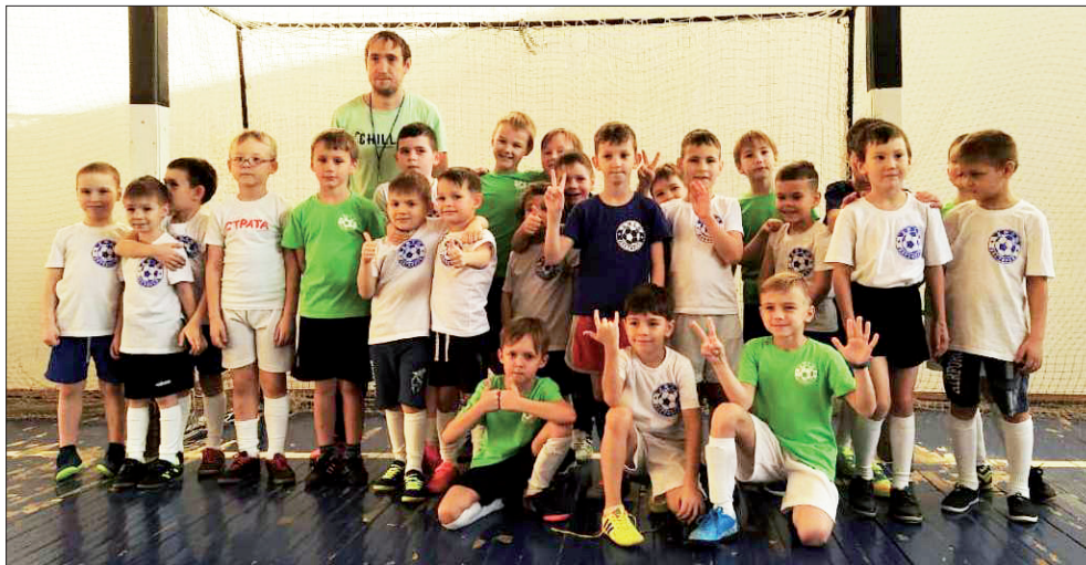
Младшая команда дегтярской ДЮСШ

В прошедшие выходные в спорткомплексе «Уралавтоматика», в преддверии новогодних праздников, прошли игры по мини-футболу среди юношей 2011-2012 и 2013-2014 года рождения. В гости к ребятам приехала команда ДЮСШ «Локомотив» из Екатеринбургa. Сначала в бой вступили старшие ребята. Игра была интересная, с обилием голевых моментов с одной и другой стороны. Только в конце матча нашей команде удалось склонить