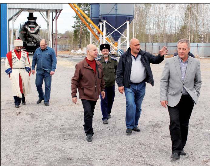
Официальных гостей знакомят с тонкостями производства и планами на будущее