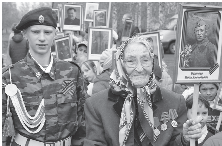
«Уважение веков»

В конце декабря состоялся муниципальный этап областного фотоконкурса «Дети. Творчество. Родина», на который было представлено 252 работы от 182 участников из 12 образовательных организаций района.