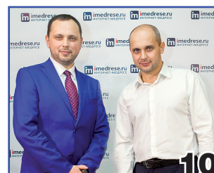
ВЕРА, ПОДКРЕПЛЕННАЯ ДЕЛАМИ