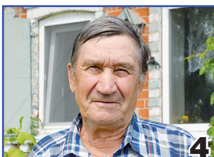
ДАЖЕ СНИТСЯ, КАК В ПОЛЕ РАБОТАЮ