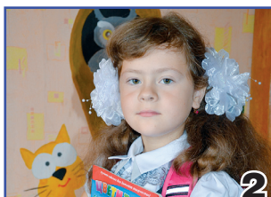
ПЕРВЫЙ РАЗ В ПЕРВЫЙ КЛАСС