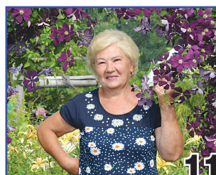
ЧЕЛОВЕК НЕУЕМНОЙ ЭНЕРГИИ