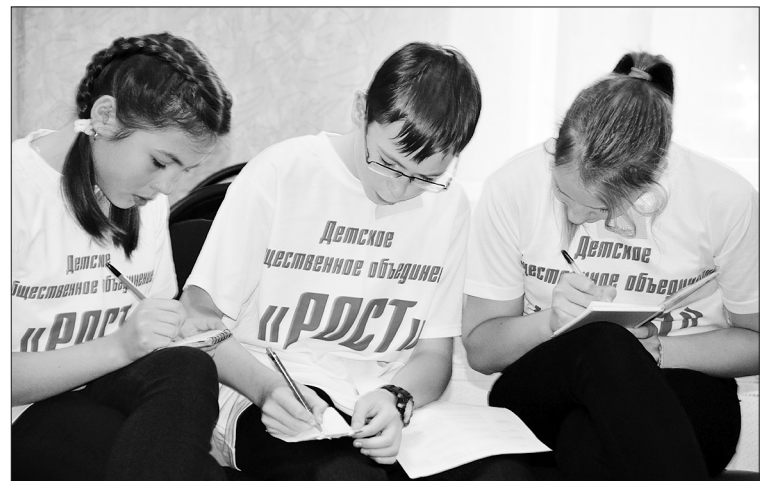
Во время проведения первого в этом году занятия районной Школы лидеров

ственных объединений. Вместе с психологами они отрабатывали с помощью тренинга умение увидеть в себе и товарищах личностные качества, которые очень важны для решения общих задач, учились искусству сплочения коллектива, элементам самоуправления. Активно принимали участие в обсуждениях, предложенных психологами тем, выполняли практические задания.