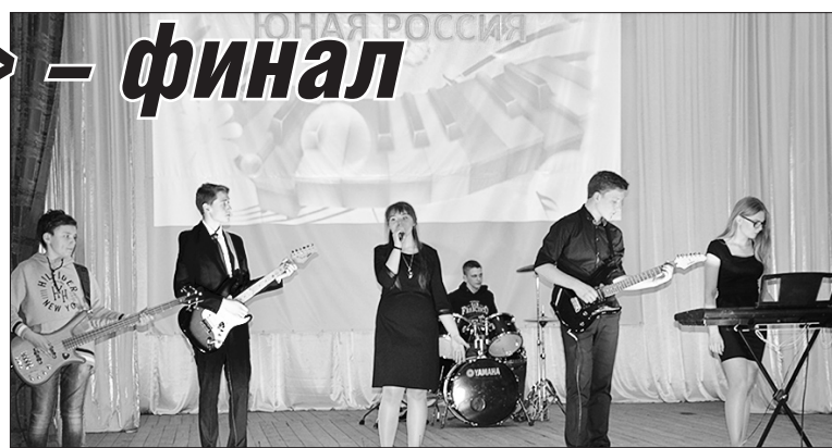
Группа «Пять в кубе»

Все номера, представленные на гала-концерте, приятно удивляли своим разнообразием и зрелищностью. Награды в этот вечер получали не только дети, выступавшие на сцене, но и те, кто принимал участие в их подготовке к конкурсу – учителя, преподаватели, музыкаль-