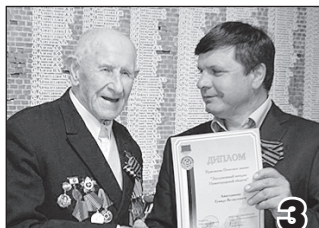
ПОМНИМ ТОТ ПОБЕДНЫЙ МАЙ