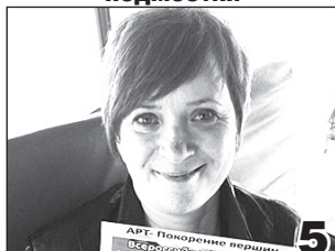
«МЕЧТЕ» ПОКОРЯЮТСЯ ПОДМОСТКИ