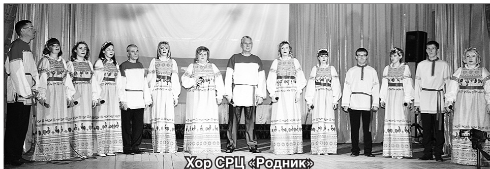
Хор СРЦ «Родник»

20 хоровых коллективов организаций и учреждений р. п. Пильна и сельских поселений 19 апреля выясняли на сцене районного культурно-досугового центра, кто же лучше, ярче и эффектнее. В районе в очередной раз прошел фестиваль-конкурс хорового пения. И с каждым годом количество желающих выступить в его рамках растет.