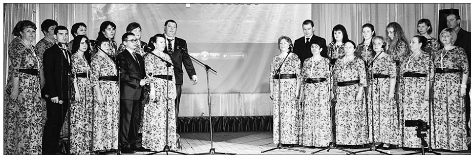
Хор Красногорского СДК

Зацепил зрителей задорным, искрометным выступлением творческий коллектив «Арт-коктейль» администрации Пильнинского муниципального района