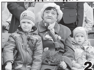
ВЕЛИКАЯ ПОБЕДА В СЕРДЦЕ КАЖДОГО