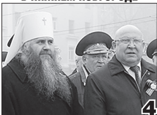
ВОЕННЫЙ ПАРАД В НИЖНЕМ НОВГОРОДЕ