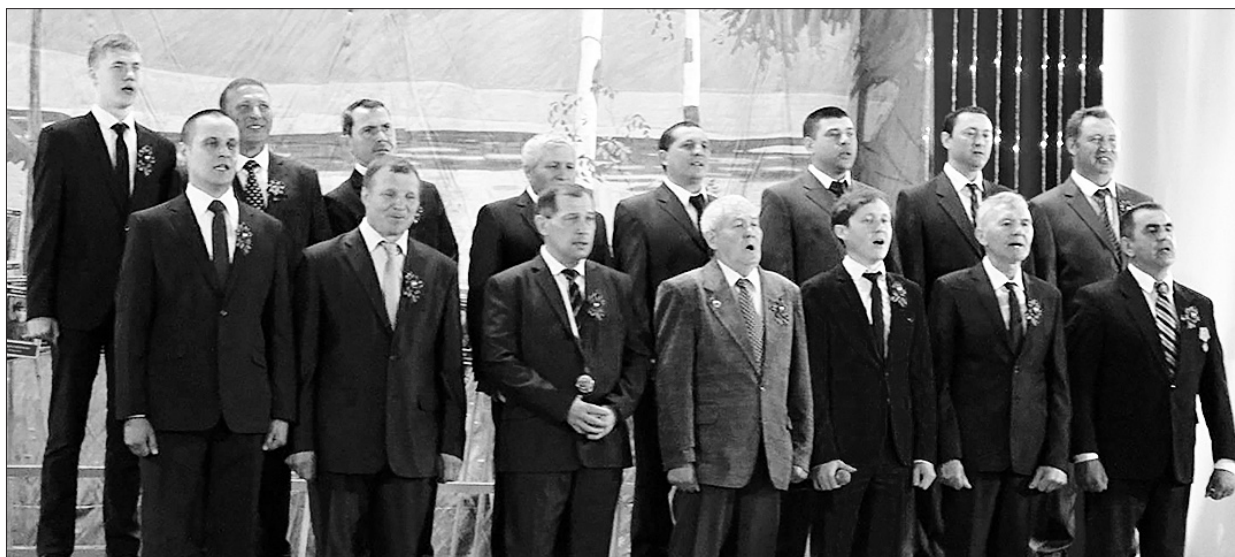
Мужской хор села Петряксы