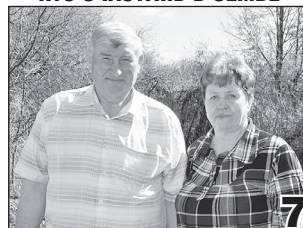
СЧАСТЛИВ ТОТ, КТО СЧАСТЛИВ В СЕМЬЕ