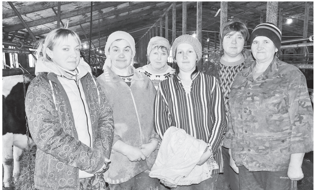
Коллектив доярок Алексеевской фермы

Полгода у нас ушло на оформление кредита в «Россельхозбанке», а полученную сумму мы потратили на новый МТЗ-82, пресс-подборщик и культиватор.