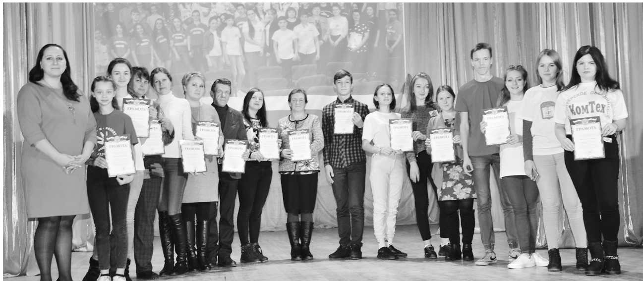
Волонтерские объединения получили Благодарственные письма