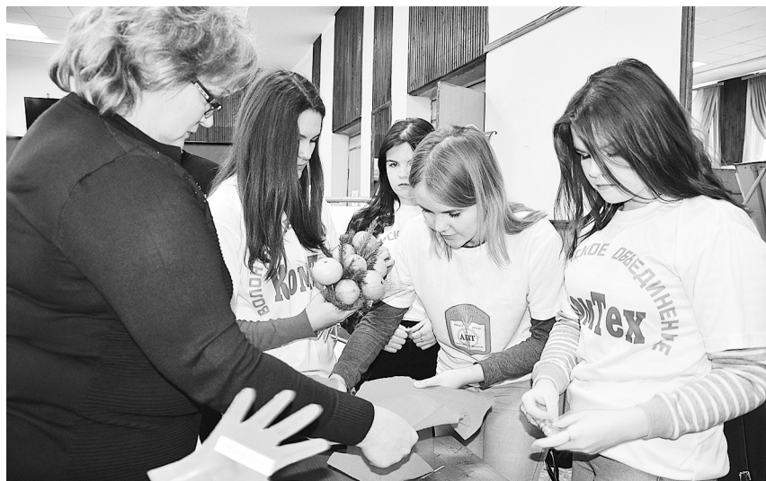
«КомТех» проводит мастер-класс

патриотическом, экологическом, спортивно-оздоровительном и многих других направлениях, где ребята смогли бы проявить себя.