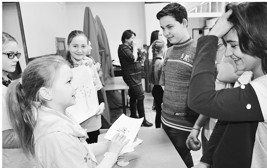
Добровольцы из Озёрок

В нашем районе еще не везде существуют волонтерские объединения, но человек с активной жизненной позицией никогда не будет стоять в стороне, и таких людей нужно поддерживать в их стремлениях. Поэтому на базе школ района ведется работа в социальном,