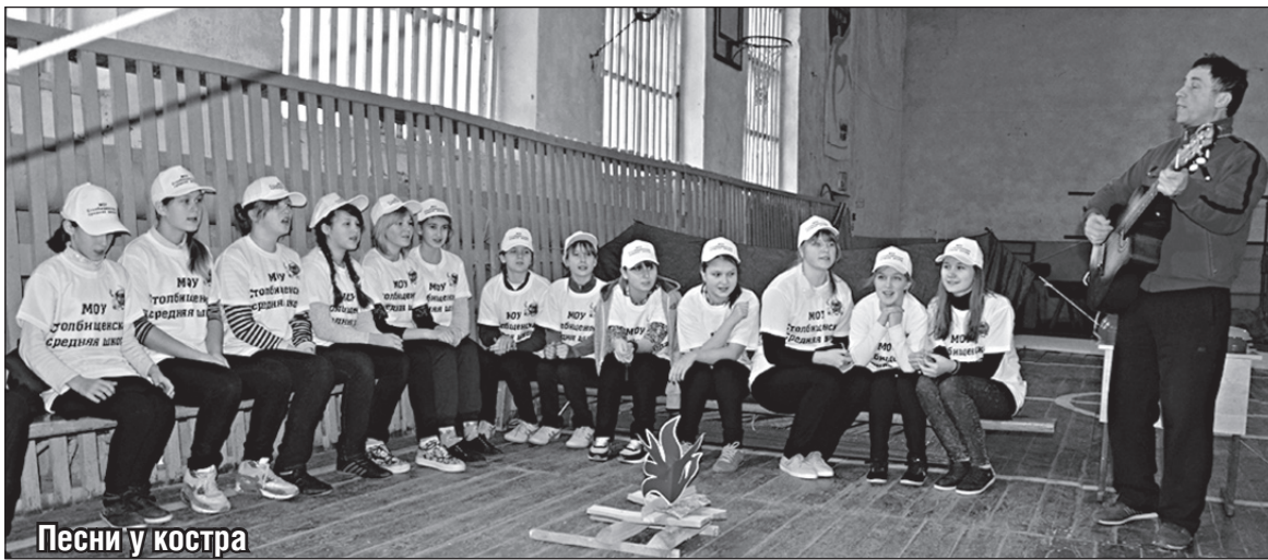
Песни у костра