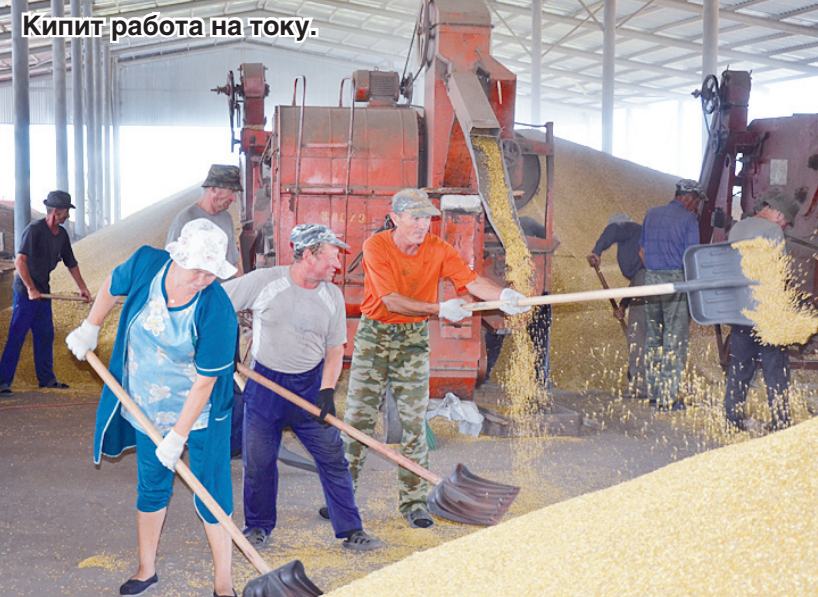
Кипит работа на току.

на яровые, но из-за того, что весной сев проводили «клинья» яровые посели неравномерно, и теперь убирать их приходится тоже участками. Не каждый комбайнер на глаз может отличить какой участок уже поспел, а на каком зерну еще надо налиться. Поэтому с 3 по 6 августа у нас будет простой в работе. К сожалению, урожайность яровых будет немного меньше, чем озимых, и здесь в первую очередь сказывается недостаток влаги, хорошие дожди во время созревания колоса обошли наше хозяйство стороной.