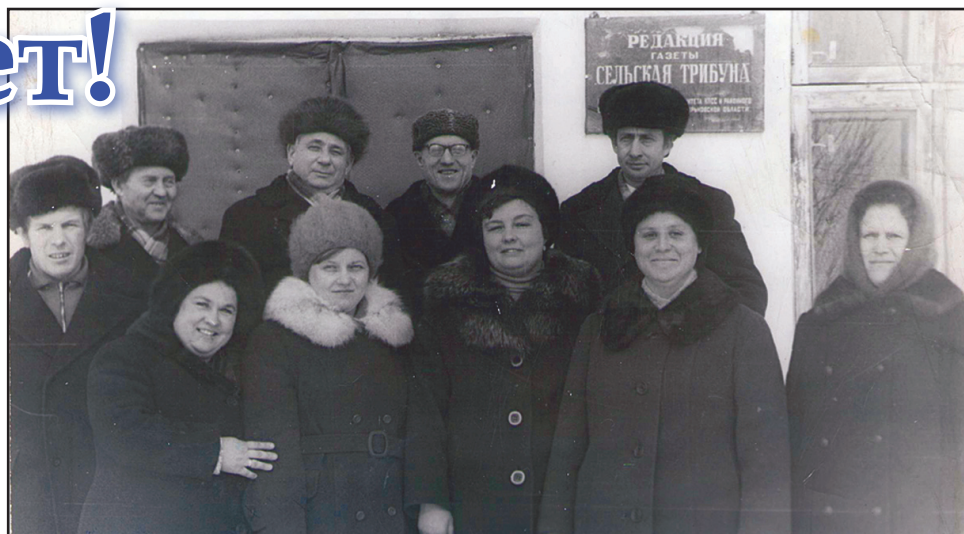
Коллектив редакции в конце семидесятых годов.

Последние пять лет перед уходом из газеты я работала заведующей отделом писем и обращений граждан. В то время у газеты было много интересных авто-