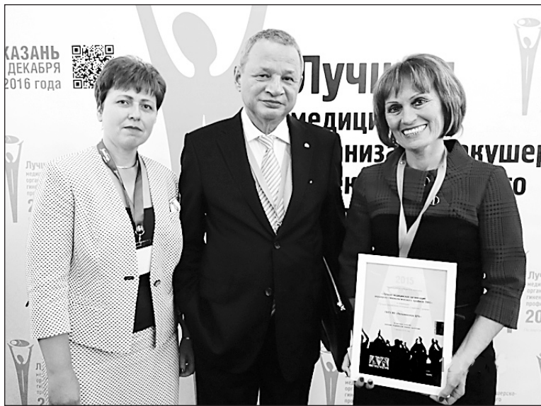
На церемонии награждения

уровня», наряду с такими медицинскими учреждениями как Сергеевская ЦРБ Самарской области, роддом клинической больницы №2 г.Оренбурга, Саратовского перинатального центра, женской консультации города Уфы и гинекологического отделения БУ «Президентский перинатальный центр» Минздрава Чувашии.