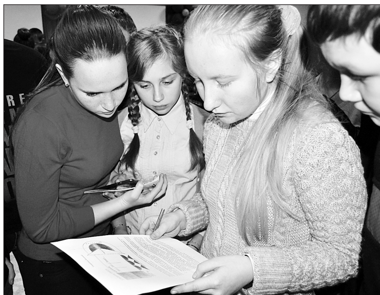
Ребята заняты мозговым штурмом

Она сразу же предложила ребятам разделиться на четыре команды и устроить мозговой штурм: создать по предложенной модели профилактический проект борьбы со СПИДом. Затруднений