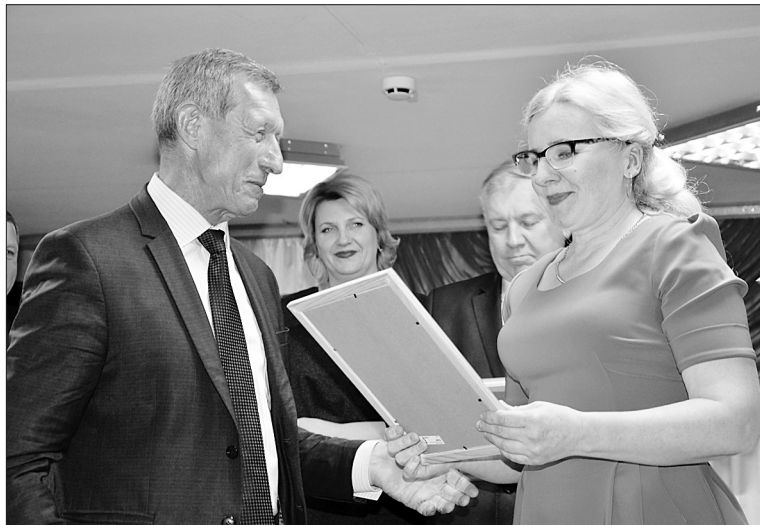
Почетную грамоту коллективу вручает министр культуры С.А. ГОРИН