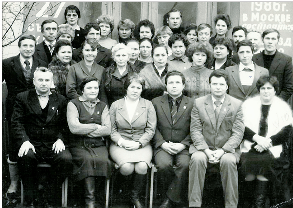
Председатели сельсоветов и заведующие отделами райисполкома