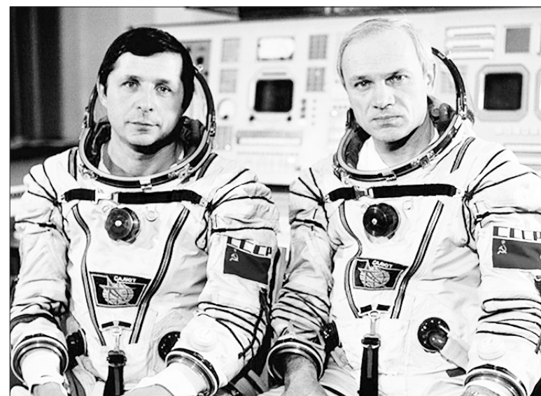
Космонавты дважды Герои Советского Союза Виктор Савиных и Владимир Джанибеков

«Нам нужно было выяснить, не опасна ли атмосфера в рабочем отсеке, - объясняет