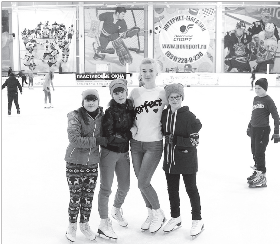
Главный приз - поездку в ФОК г. Сергач выиграли «Марафонцы»

Выполнение заданий предполагало использование фото и видеотехники, социальный опрос среди учеников, родителей и педагогов, активную