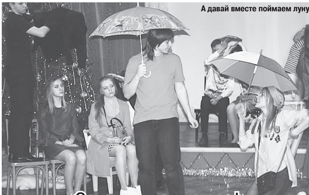
А давай вместе поймаем луну

Поэтому сказка была не только яркой и веселой, но еще и поучительной.