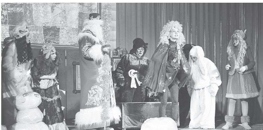
Не место жадности в лесу

Так называлась новогодняя пьеса-сказка, которую показали всем 2 января артисты Пильнинского РКДЦ.