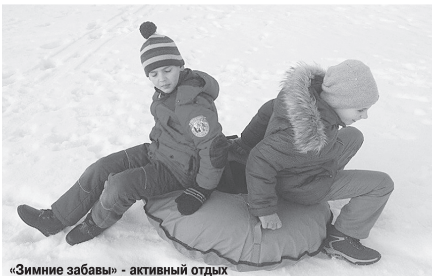
«Зимние забавы» - активный отдых

Министерство спорта России приняло решение о ежегодном проведении Декады спорта и здоровья в период зимних каникул. Основной её задачей была пропаганда здорового образа жизни и привлечение большего числа обучающихся к активному отдыху на свежем воздухе, организация содержательного досуга для ребят.