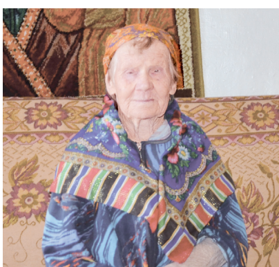
6 90... это много или мало?