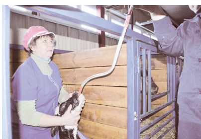
2 В Жданове родилась Сказка!

№ 49 (11155) СУББОТА, 7 ДЕКАБРЯ 2019 ГОДА