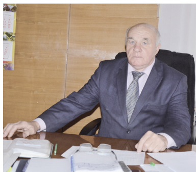
3 Патриот родной земли

№ 40 (11146) СУББОТА, 5 ОКТЯБРЯ 2019 ГОДА