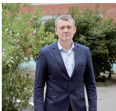
6 Мое призвание - школа