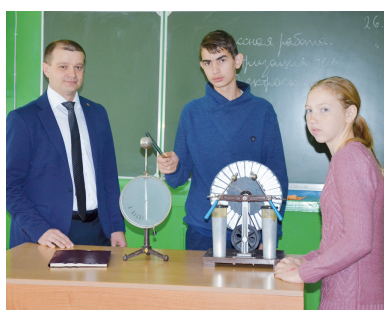
7 Шахматная логика уроков и здоровый дух