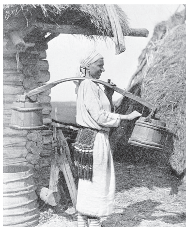
5 Уходящая Мордовия. Эрзянские села Нижегородского Присурья