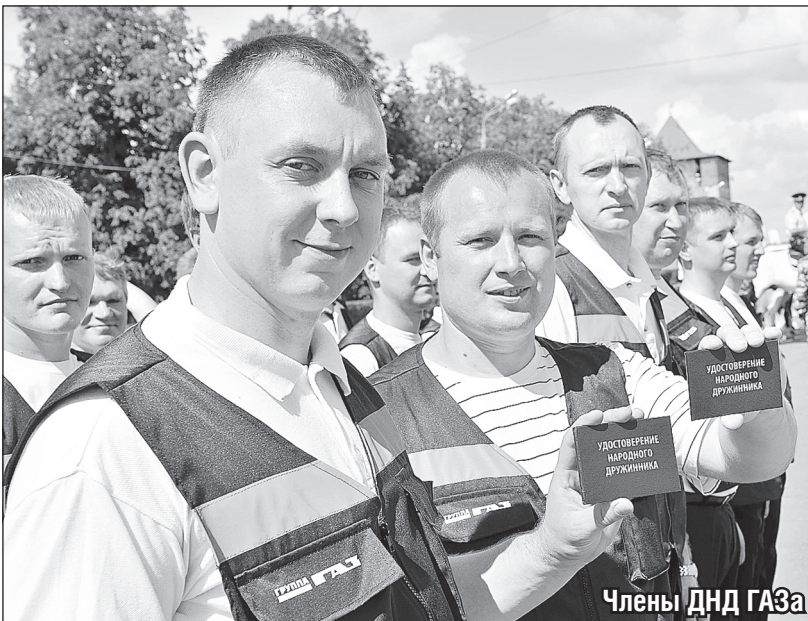
Члены ДНД ГАЗа

Инициатива регионального правительства по возрождению ДНД позволила на четверть снизить уровень преступности в Нижегородской области