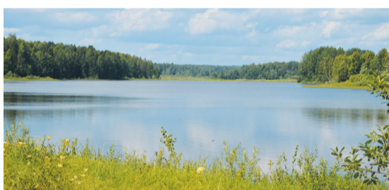
● Орлихинское водохранилище