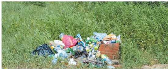
● Мусор, оставленный отдыхающими