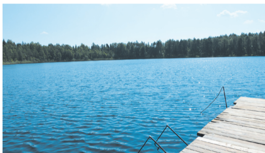
● На берегу Кочешковского озера