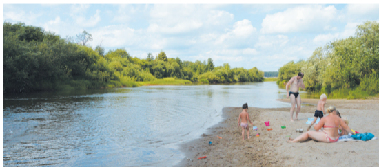
● На уренском пляже