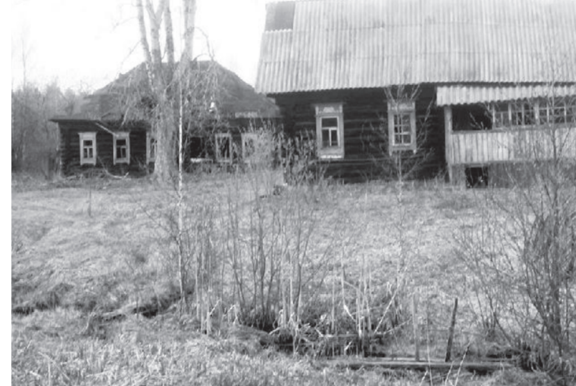
● Так деревня Аксёново выглядит сегодня

Дерева запомнились мне самыми любимыми тополями, которыми были установлены скамейки. Здесь традиционна собиралась деревенская молодёжь, голоса и залихватистый смех. Большая черёмуха, растущая возле дома деда и бабушки, весной утопала в облаке белых душистых цветов, а летом была усыпана чёрными блестящими ягодами. Я и сегодня помню их виажущесладковатый вкус.