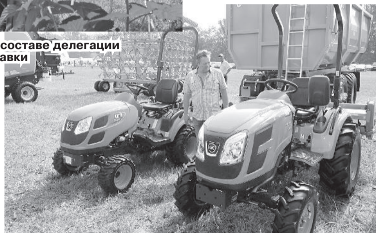
● Современная сельскохозяйственная техника