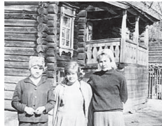
● Возле дома А.Н. Смирновой, 1960-е годы