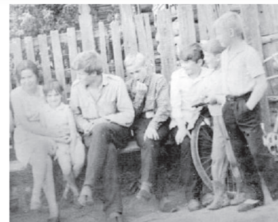
● Посиделки возле дома Коминых