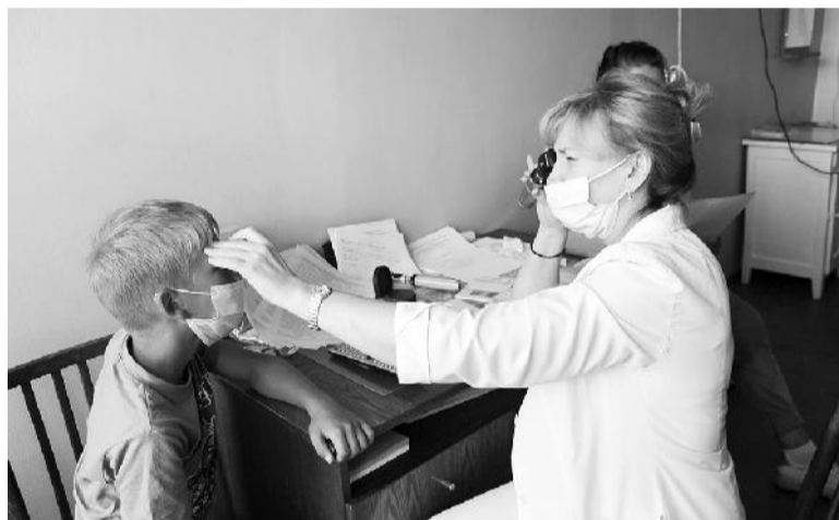
● На приёме у офтальмолога

только по направлению, решил счастливым случай не упустить. С утра приехали. Были у хирурга, сделали УЗИ брюшной полости, побывали у лор-врача, осталось проверить зрение и сказать спасибо врачам областной больницы за то, что к нам приехали.