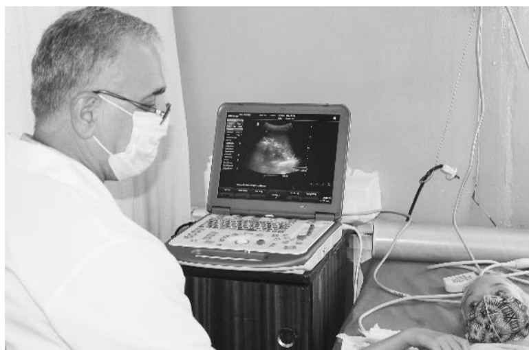
● Диагностика УЗИ-аппаратом

На моей памяти такого ещё не было, – говорит он. – Поскольку узких специалистов в области педиатрии в Урене нет, а в областную больницу можно попасть