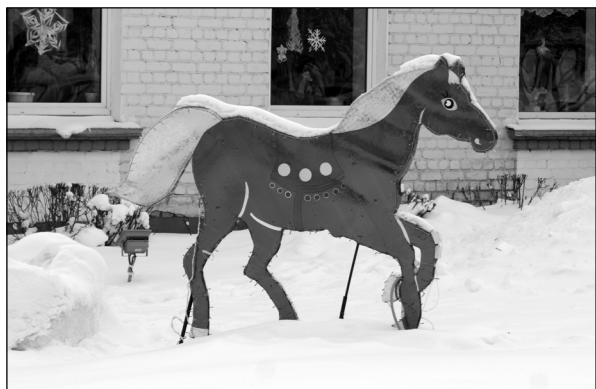
• Символ нового года на территории детской школы искусств.