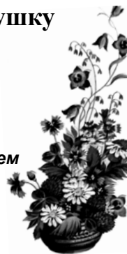
Жена, дети, внуки

Юбилей – такой прекрасный праздник: Радостный, чудесный и красивый. Лучший день, чтоб пожелать всем сердцем Жизни интересной и счастливой. Пусть отличным будет настроение, Близкие любовью согревают, Пусть всегда здоровье будет крепким, И в делах удача помогает.