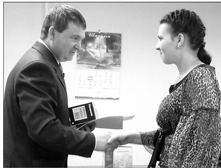
• Награждается коллектив детского сада «Светлячок».