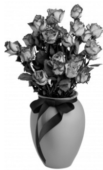
Коллектив ООО «Союз»

У Вас сегодня юбилей – День радостных переживаний. Пусть будет на душе теплой От добрых слов и пожеланий. Желаем счастья и добра, Здоровья, радости и силы. Душа пусть будет молода – Неважно, сколько лет пробило.