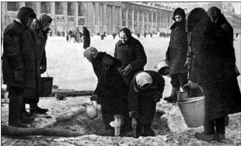
Без воды, без тепла, без света день похож на черную ночь. В мире, кажется, силы нету, чтобы все это превозмочь...