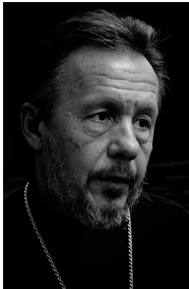
• В. Гофман

- Может ли быть Святое Причастие "во грех и в осуждение", как об этом говорится в молитве священника перед причастием?