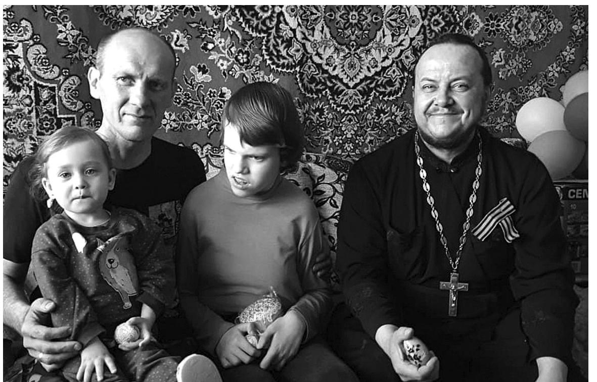
• В семье Комлевых