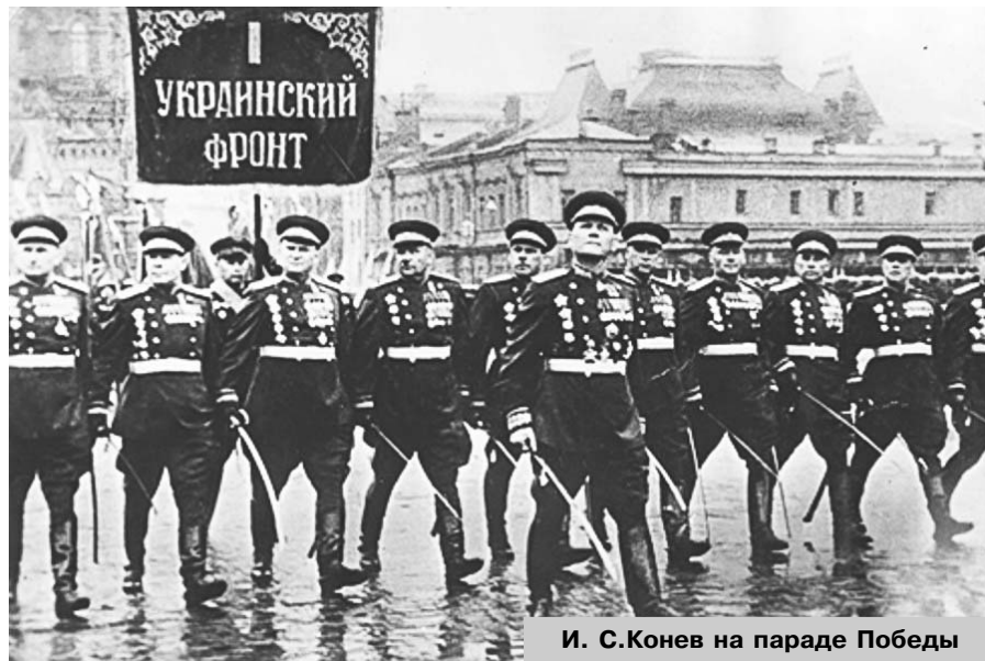
И. С. Конев на параде Победы