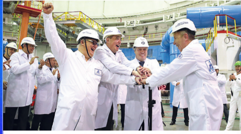
Новости области: с задумом на будущее