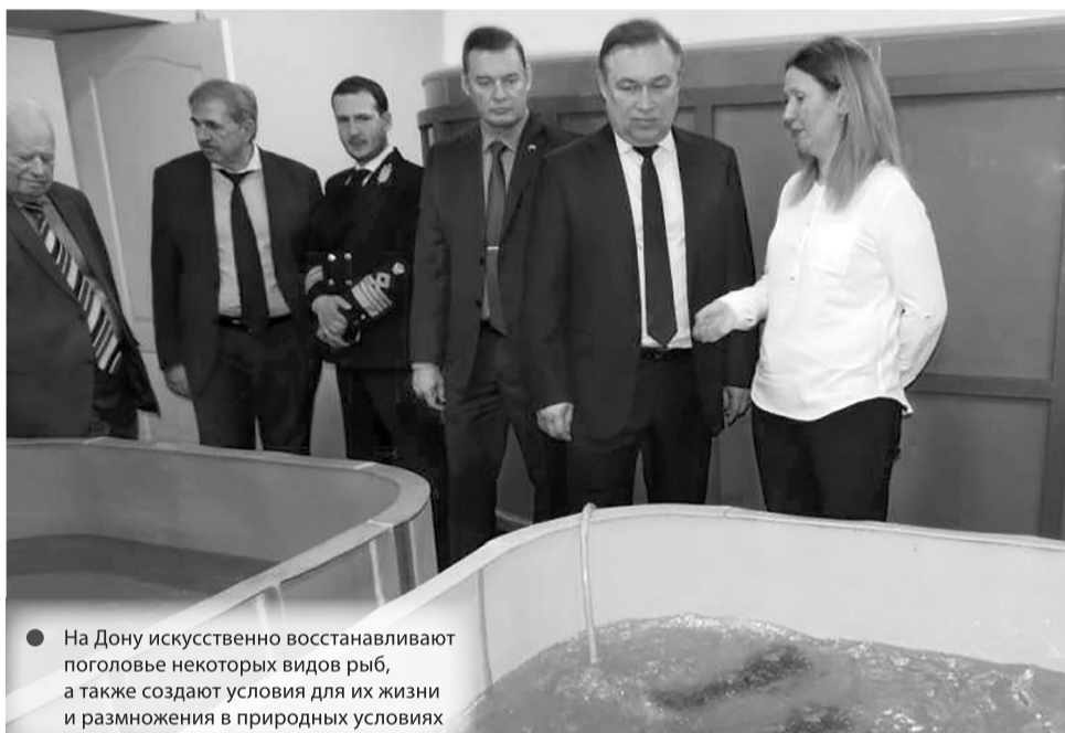
● На Дону искусственно восстанавливают поголовье некоторых видов рыб, а также создают условия для их жизни и размножения в природных условиях

Но несмотря на положительную динамику в развитии рыбохозяйственного комплекса Дона, существуют и проблемы, оказывающие серьезное сдержива-