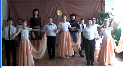
Образование: большой талант требует большого трудолюбия