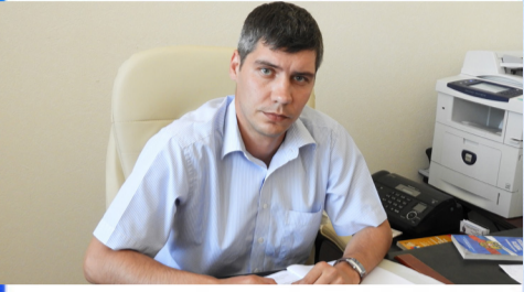
О важном: главная забота - права людей