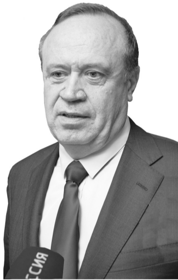
● Министр ЖКХ Сергей Сидаш обрисовал перспективы капитального ремонта

Собственники, которые перечисляют плату на счет регионального оператора, смогут провести ремонт за счет дополнительно привлеченных средств. При этом после проведения ремонта и сдачи соответствующих документов