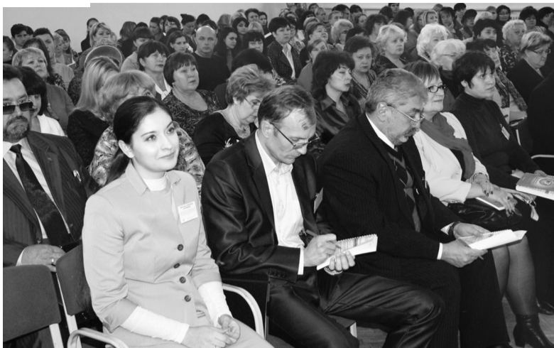
● Гражданский форум собрал представителей власти и экспертное сообщество