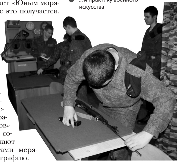
... и практику военного искусства

Патриотизм на практике – это то, без чего не может обойтись ни один житель этой планеты. Ведь гражданскую идентичность даже в эпоху моды на безграничную толерантность и культурную ассимиляцию никто не отменял.