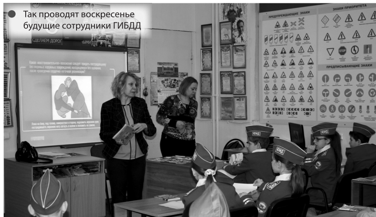
Так проводят воскресенье будущие сотрудники ГИБДД