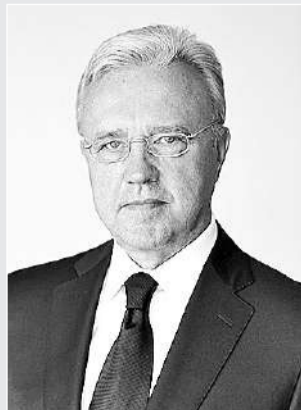
Александр Викторович УСС, губернатор Красноярского края

– В течение года система исполнительной власти уже подвергалась определенным изменениям. Они касались как ее архитектуры, так и конкретных персоналий. В то же время задачи, которые стоят перед нашим краем, потребовали дополнительных корректив. Уверен, что новый состав правительства края сумеет справиться с теми непростыми задачами, которые стоят сейчас перед нами.