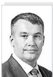
Виталий Степанович ДЕНИСОВ – министр здравоохранения