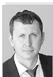
Константин Николаевич ДИМИТРОВ – министр транспорта