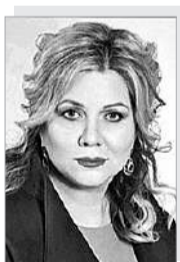
Марина Юрьевна ПОНОМАРЕНКО – министр тарифной политики