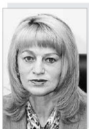
Светлана Ивановна МАКОВСКАЯ – министр образования