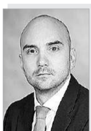
Егор Евгеньевич ВАСИЛЬЕВ – министр экономики и регионального развития