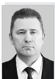
Евгений Евгеньевич АФАНАСЬЕВ – министр промышленности, энергетики и жилищно-коммунального хозяйства