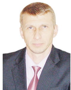
Глава Ординского района А.С. Мелёхин

Новый год – праздник, всеми любимый. Он несет в себе надежду на лучшее. Пусть Новый 2019 год подарит вам множество приятных открытий и новых интересных событий. Искренне желаем добра, счастья, удачи!