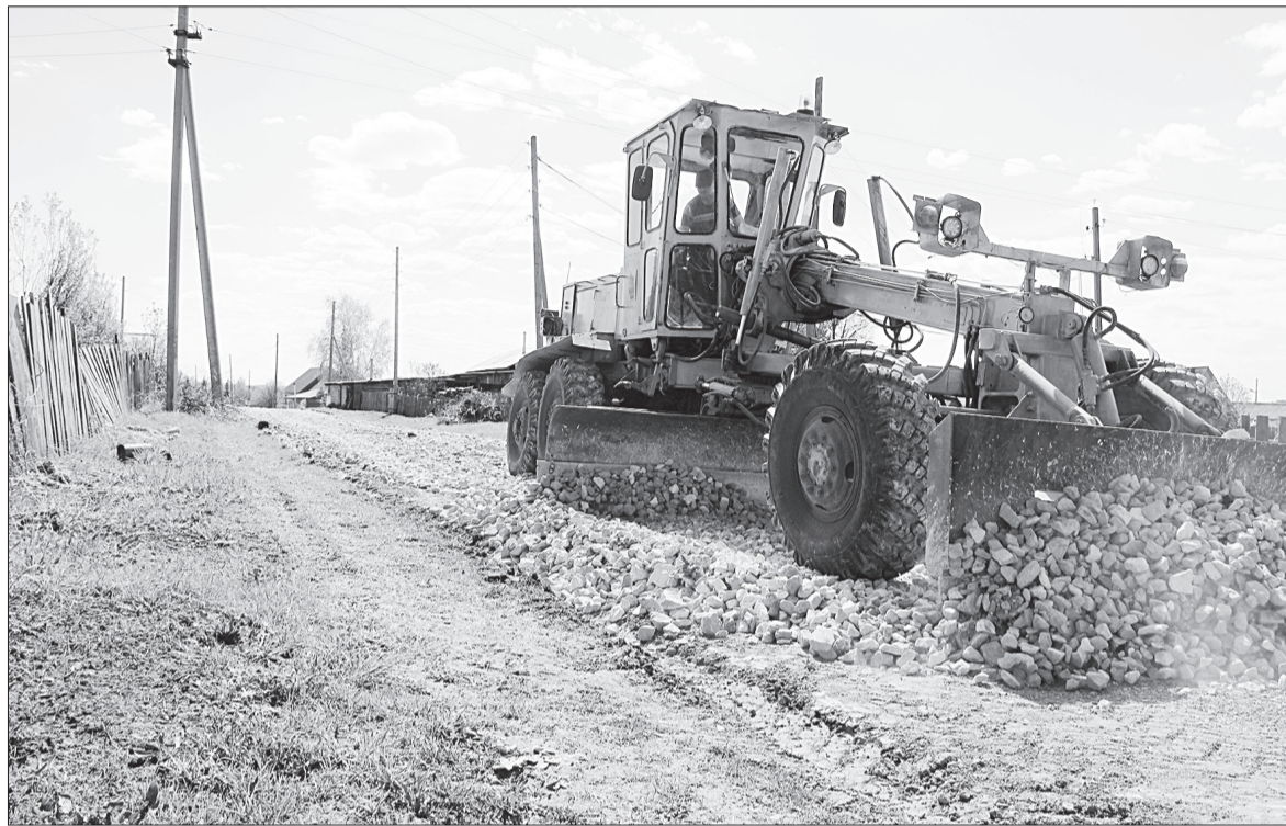
Компания «ОрдаДорИнвест» обслуживает не только муниципальные дороги. Предприятие ремонтирует в Орде улицу Труда протяженностью 1,7 км.

ДОСЬЕ. Александру Деревянных 41 год. Работал водителем, механиком ОПО, зам. председателя по административно-хозяйственной части. Имеет среднее профессиональное образование.