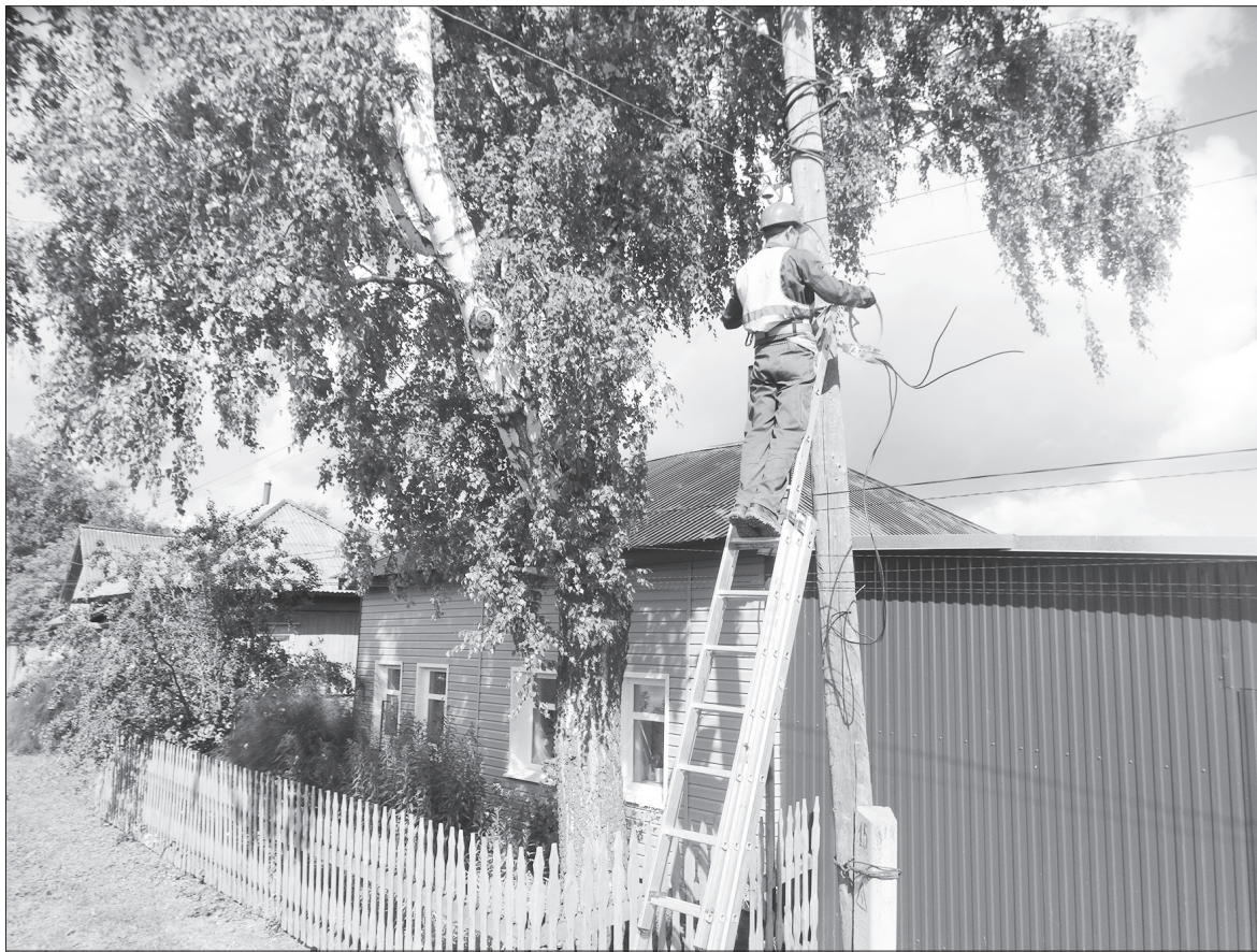
Новые приборы учета электроэнергии установлены в Серкино и Курилово. Работы продолжаются по улице Беляева в Орде.

Сегодня, 16 августа, через конкурс-испытание проходят кандидаты на должность главы Красносельского поселения, завтра, 17 августа, Медянского поселения.