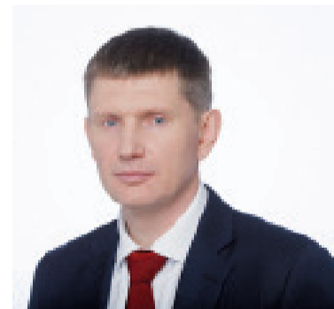
Глава Пермского края Максим Решетников

Всем героям и участникам Великой Отечественной войны, всем, кто ковал Победу в тылу, – бесконечное спасибо. И – низкий вам поклон!