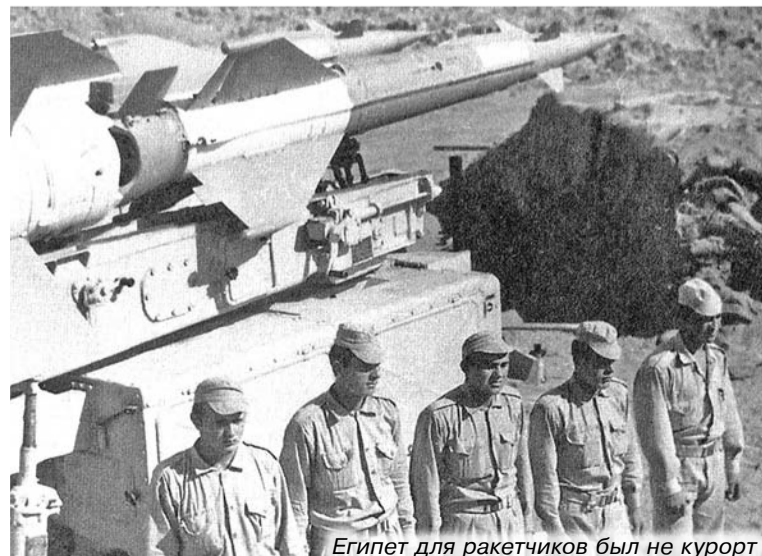
Египет для ракетчиков был не курорт

У советских участников арабо-израильского конфликта свое боевое братство. Ежегодно ветераны-ракетчики собираются в Москве и вспоминают бои «давно минувших дней». Каждый из них знает: вклад в дело мира – это не высокие слова, за ними стоят пот и кровь русских воинов.