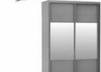
ШКАФ-КУПЕ ХИТ 1200X2200X600 мм 9.490