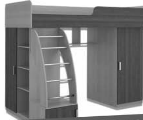
КРОВАТЬ МИКА 2042X1800X1200 мм 14.990