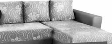
ДИВАН-КРОВАТЬ ФАНТАЗИЯ УГОЛ с фантомными подушками с ортопедическим основанием 20.990