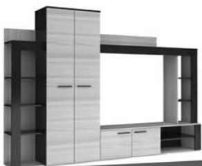
СТЕНКА ОСЛО 2310X1835X365 мм 8.800

0% ПЕРЕПЛАТЫ ЗАЧЕМ ЖДАТЬ И КОПИТЬ? * РАССРОЧКА НА МЕБЕЛЬ