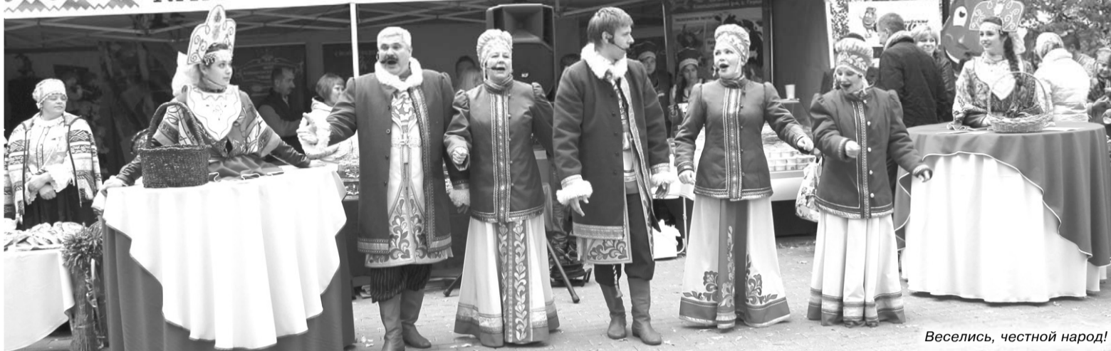
Веселись, честной народ!