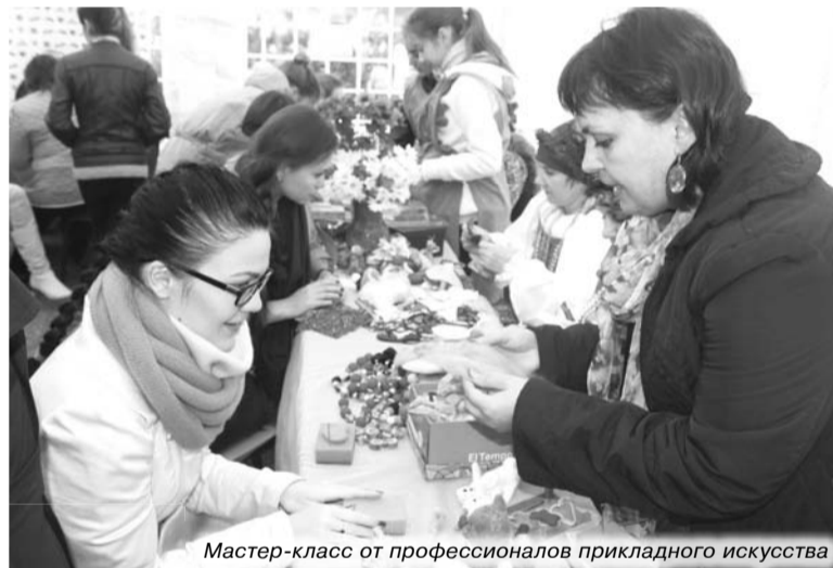
Мастер-класс от профессионалов прикладного искусства