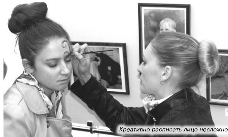
Креативно расписать лицо несложно