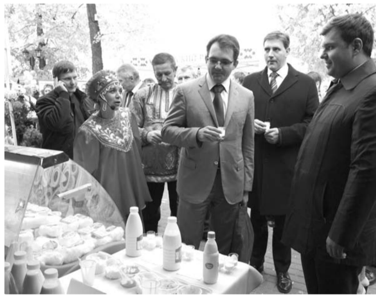
Пейте наше молоко – будете здоровы!