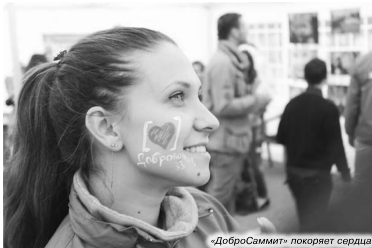
«ДоброСаммит» покоряет сердца