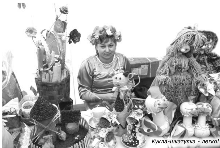
Кукла-шкатулка - легко!

От нашего района на праздник прибыли более 100 человек. В шатре под названием «Семья, материнство, детство» мастер-классы по различным видам рукоделия показывали восемь умельцев из Домов культуры района. Важно, что наши «места» за все время праздника не пустовали - желающие научиться делать куклы своими руками или нарисовать с помощью аквагрима рисунок на теле образовали большую очередь. Даже губернатор Светлана Орлова не обделила вниманием наш шатер. Как собственными руками можно шить великолепную