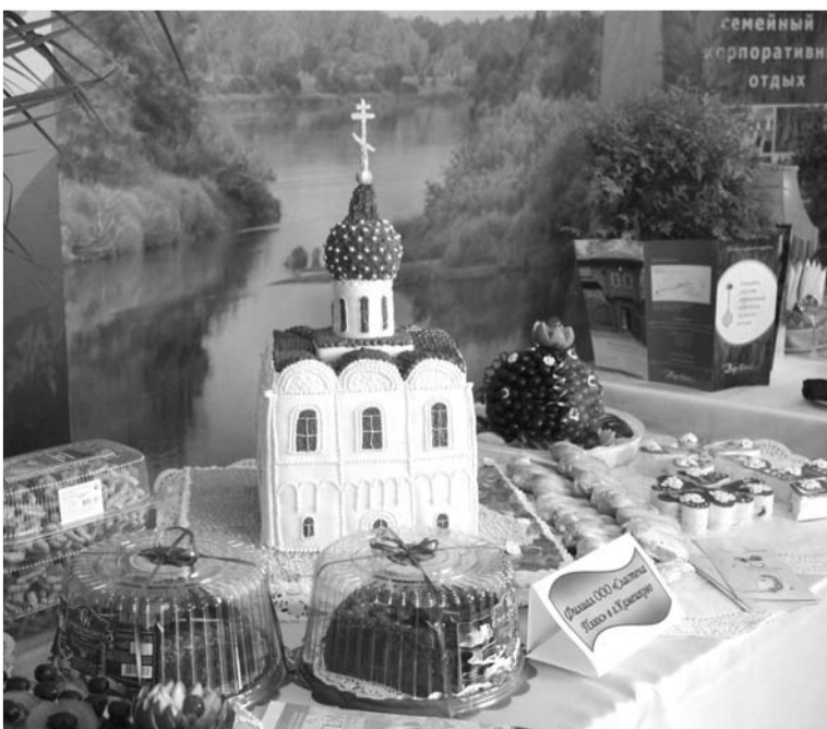
Подарки сладкоежкам от «Сластены»

В числе постоянных участников областной осенней ярмарки значится и ООО «Сластена Плюс», которое выпускает вкуснейшие торты и пирожные. Сегодня в ассортименте фирмы – более 40 видов продук-