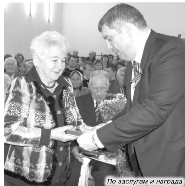
По заслугам и награда